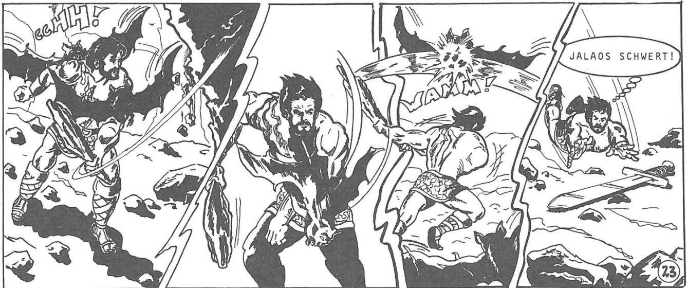
Aus «Herkules – Die Höhle des Todes», Banemann & Groth, Berlin