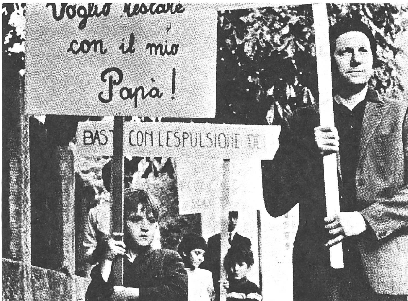
Dem Bundesrat nicht genehm: «Lo Stagionale» von Alvaro Bizzarri

Spielfilm von Alvaro Bizzarri (Schweiz 1971). – Das Schicksal eines Saisonarbeiters, der sich nach dem Tode seiner Frau in