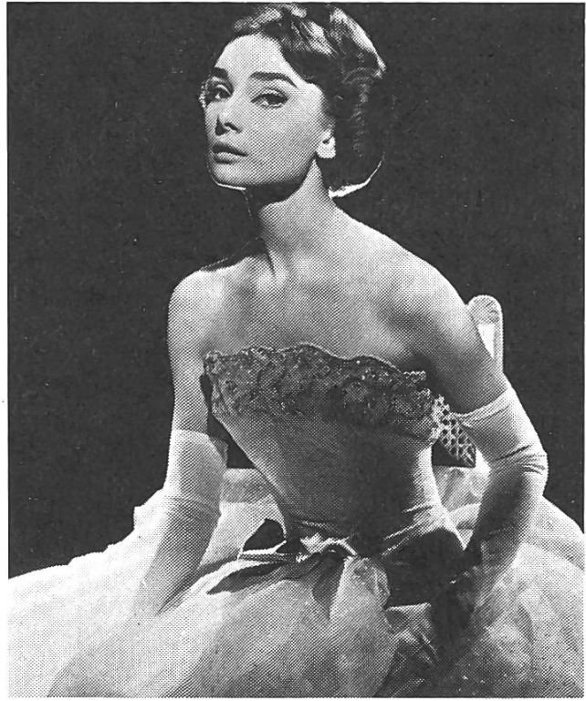
Heilige und Schlampen: Brigitte Bardot, Audrey Hepburn ...

Truffaut widmet seine «amerikanische Nacht» dem Geschwisterpaar Dorothy und Lilian Gish, und damit – eher unabsichtlich wohl – auch der Frau im Kino schlechthin: Denn: Lilian Gish und Dorothy Gish repräsentieren die beiden im Kino möglichen Typen von Frau, bis auf den heutigen Tag. Lilian – das liebe, gute, nette, anständige Mädchen, das eines Tages geheiratet wird; Dorothy – die verluderte, hinterlistige, unanständige Schlampe. Während Lilian vor dem Bettchen kniend betet: «Lieber Gott, mach dass er mich liebt» und sich dann unter die Decke trollt, beschmiert sich Dorothy in einer zwielichtigen Gasse mit Parfüm und giesst den Rest der Flasche einfach in den Busenausschnitt. Lilian macht die Augen zu und streckt, Hände auf dem Rücken, ihr Kussmündchen in den Himmel; geküsst vollführt sie händereibend einen Freudentanz – wenn es niemand sieht. Dorothy dagegen zieht sich am Rockkragen den erstbesten Mann, dessen sie habhaft werden kann, mag er stockbesoffen sein oder nicht, zu sich heran und flötet bedrohlich: «Na Kleiner, wie wär's denn mit uns zwei.»