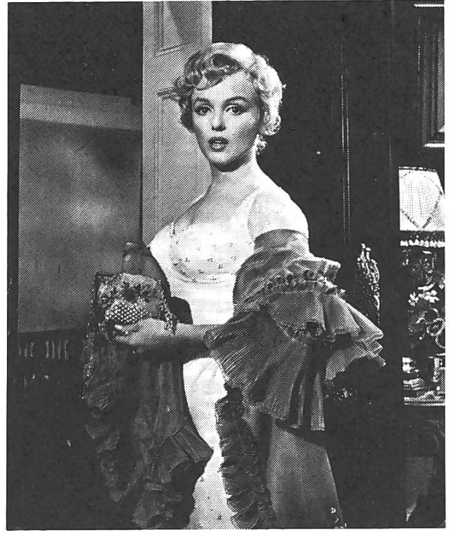
... Giulietta Masina, Marilyn Monroe

Nun, Western werden von den meisten sogenannten ernsthaften Leuten verkannt und darum verachtet. Damit ist also nicht gut argumentieren. Das Bild von den beiden Typen der Frau steckt aber so tief in unserer Kultur, dass man ruhig einmal über den Film hinausgehen darf. Wie wär's mit einem grossen Philosophen und Theologen, dem heiligen Augustinus? Mindestens gehen diese «Western-Klischees»(!), wie Bertrand Russel in seinen «Unpopulären Essays» ausführt, auf wenigstens den heiligen Augustinus zurück. Theologisch werden die beiden Frauentypen, die Heiratsfähige und die Schlampe, repräsentiert durch die heilige Jungfrau Maria und die Eva mit dem Apfel.