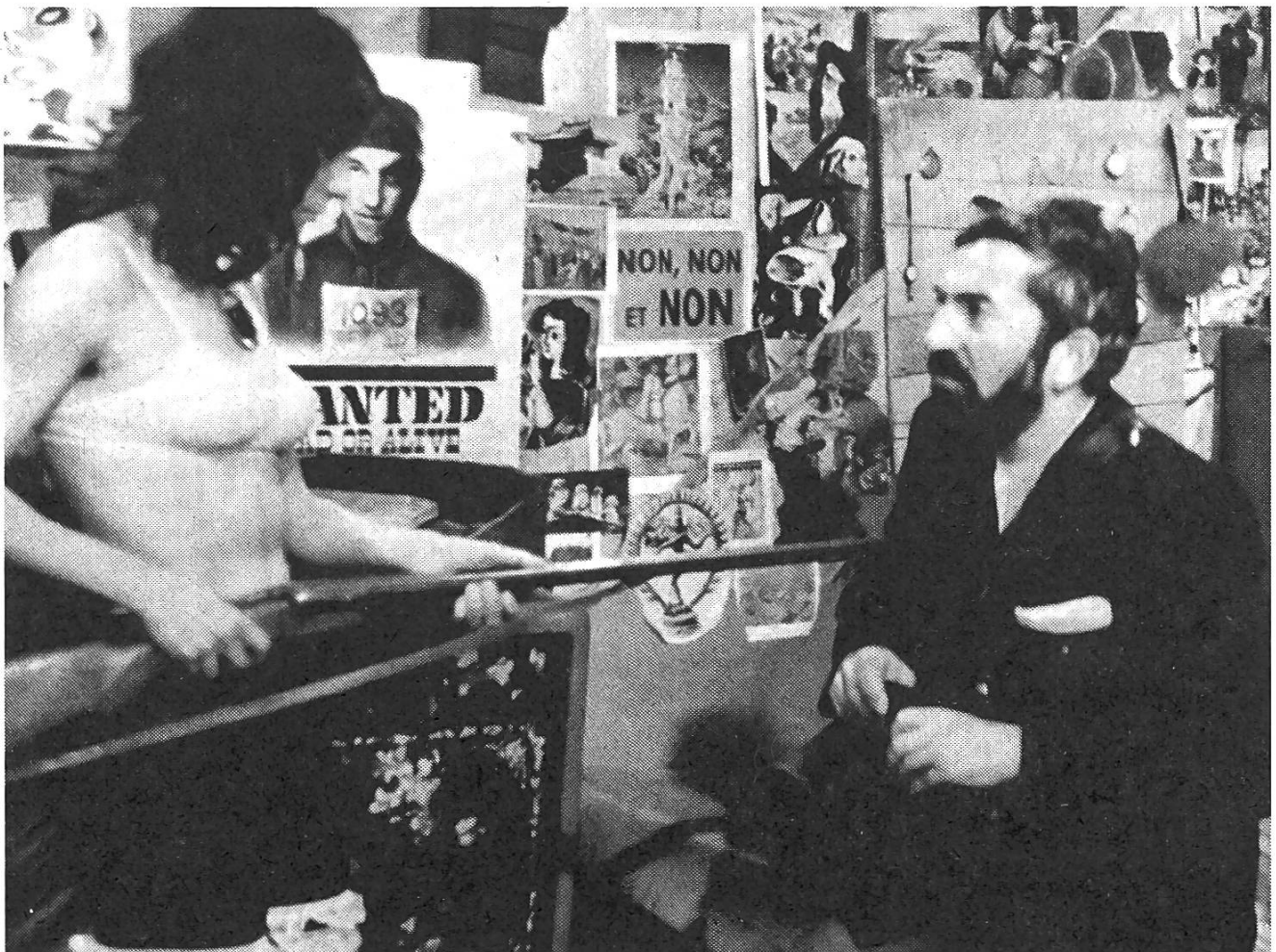
Die Dorfprostituierte bleibt Siegerin: « La fiancée du pirate »

« La fiancée du pirate » zeigt die Ausbeutung und ihre Umkehrung, den privaten Aufstand mit der individuellen Waffe – oder auch: die Rache einer Misshandelten. Das Mädchen Marie, welches sich als Waise auf einem Bauernhof abrackert und sich täglich von jedermann sagen lassen muss, sie sei eine Zigeunerin, eine nutz- und wertlose Schlampe, wird zur Dorfprostituierten, nachdem man ihr auch noch das letzte, was ihr lieb war, genommen und sinnlos zerstört hat – aber für einmal ist das weder traurig noch tragisch. Schon zuvor hatte Marie herzuhalten, wenn einer seine überschüssigen Triebe abregieren wollte, aber jetzt lockt und reizt sie syste-