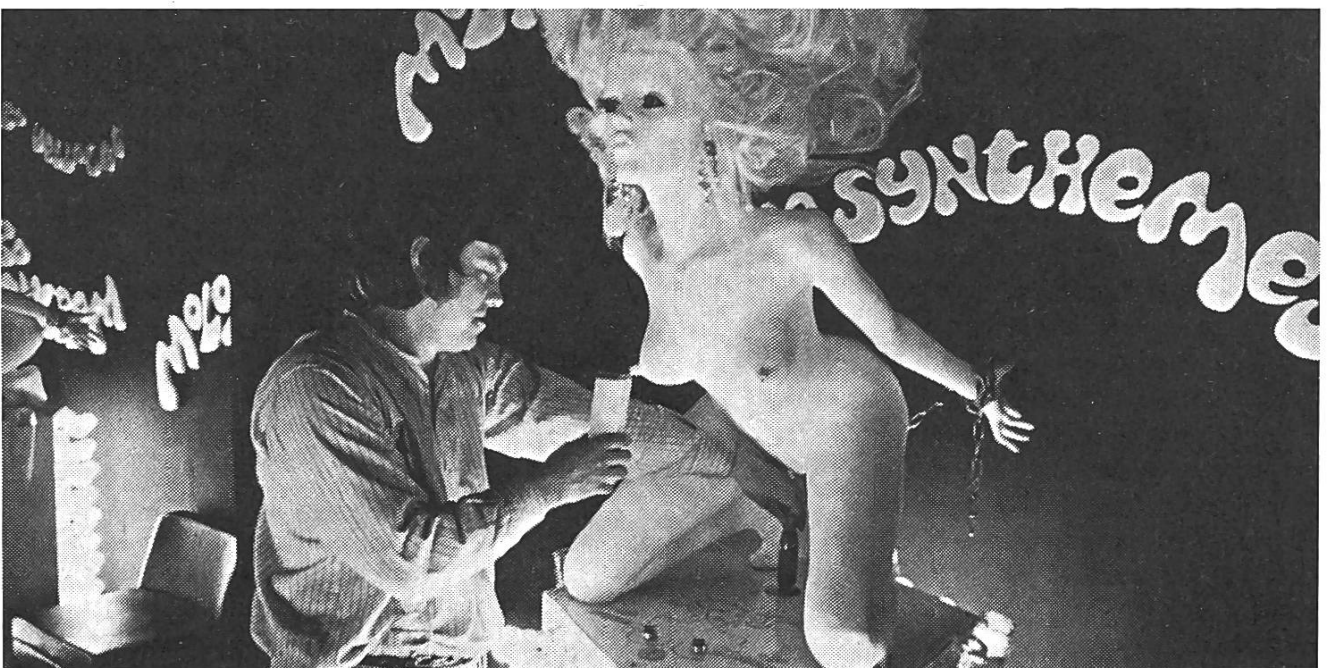
Nicht gerade vornehme Haltung gegenüber der Frau: «A Clockwork Orange»