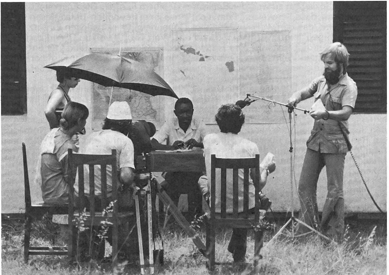
Dreharbeiten zu «Ujamaa 74»

Ziel des Filmes ist es, diesen Versuch des Sich-vorwärts-Bewegens, die Suche nach einer neuen Identität des Afrikaners, den Ausbruch aus den herkömmlichen Produktionsgewohnheiten zu zeigen. Gesucht wird die Form der Selbstdarstellung, wobei es dem Filmteam nicht immer leichtfiel, die eigenen Gewohnheiten und Überlegungen in den Hintergrund zu stellen. An der Geschichte eines Dorfes (Mahembe) und aus der Sicht des Dorf-Chairman sowie der Leiterin der Frauenbewegung sollte die Entwicklung dargestellt werden. Dabei musste das immerhin nicht ganz kleine Filmteam das Vertrauen der Dorfbevölkerung gewinnen. Vertrauen gewinnen, heisst heute nicht mehr, jene Kamerascheu der Eingeborenen zu überwinden, wie uns dies etwa noch aus der Lektüre bekannter Afrikaforscher geläufig ist, sondern es bedeutet, den selbstbewussten Afrikaner, der sich heute weigert, wie ein Ausstellungsobjekt oder ein seltenes Tier abphotographiert zu werden, von der Wichtigkeit und Notwendigkeit einer solchen filmischen Arbeit zu überzeugen, indem er erfährt, dass seine eigenen Werte und sein gehobenes Selbstbewusstsein zum Ausdruck kommen, dass sich das Filmteam mit ihm identifiziert.