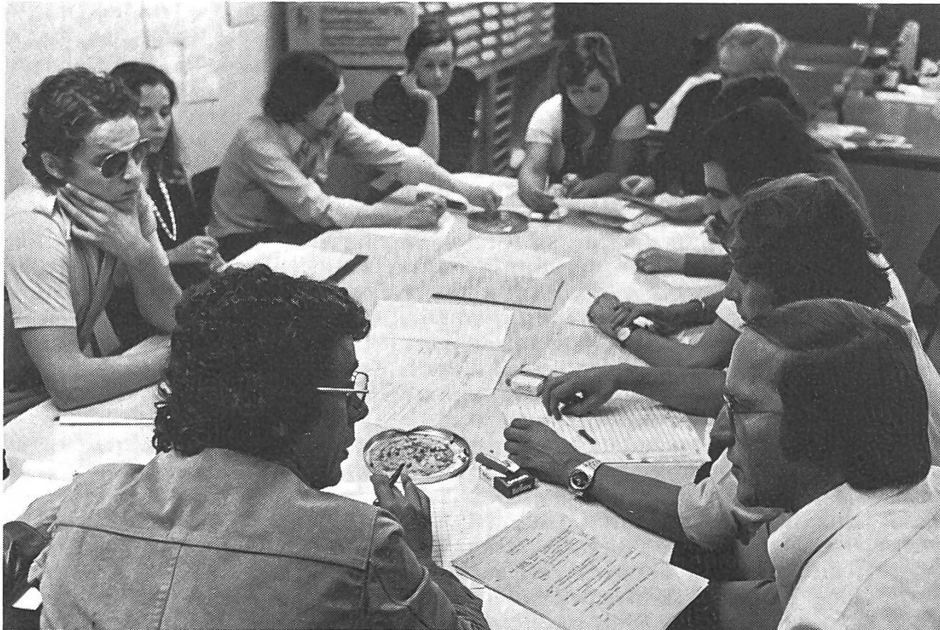
14.00 Uhr: An der Inland-Äusland-Sitzung wird die vorläufige Reihenfolge der Themen und Beiträge festgelegt.

Die Uhr wird eingebledet. Wirklichkeit. Das Tagesschau-Signal ertönt. Die Welt erscheint im Bild. Sie kommt näher. Sie wird grösser. Tagesschau. Die Informations-Illusion beginnt. Sie beginnt schon mit dem Wort «Tagesschau». Es gibt uns vor,