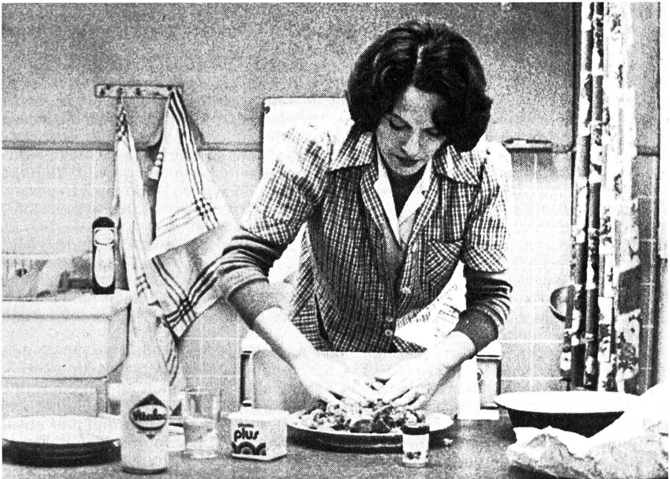
Die ungeheure Entfremdung einer Frau um die dreissig: «Jeanne Dielman» (Delphine Seyrig)

Verstehens zu werden. Heinrich wünscht sich ein Kind – am liebsten bekäme er es selber! – und ist ja selbst noch zu sehr ein Kind, das mehr nach mütterlichem Verständnis sucht, als nach erwachsener Kommunikation oder wirklicher Partnerschaft. So wichtig es Grischa für sich und alle Frauen empfindet, die Sehnsucht nach einem Kind zu stillen, so gross sieht sie doch auch die Verantwortung, die dahintersteht. Weiter sucht sie auf tastendem Weg nach mehr Klarheit und Inhalt: Sie interviewt Arbeiterinnen, die ihre Sorgen, Verhältnisse, Beziehungen zu Mann und Kindern erzählen. Grischa tut es nicht für eine Statistik, eine Polemik oder eine Organisation, sie will für sich allein wissen und lernen und zu mehr Sicherheit über ihren eigenen Weg gelangen.