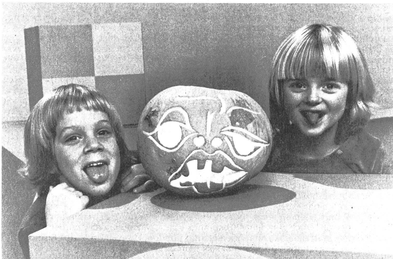
Aus der Sendung für Kinder «Das Spielhaus» vom 13. September 1977: Esther und Titus

einer grundsätzlich anderen Lage befinden: Auch sie sind Erwachsene und erheben den Anspruch, aufgrund ihrer Erfahrung und ihrer theoretischen Einsichten kindliche Bedürfnisse ab- und erklären zu können. Sie führen damit die zumindest seit der Erstauflage des Struwwelpeters (um 1850) gültige Tradition weiter, erzieherische, d. h. weltanschauliche Werte über Massenkommunikationsmittel zu verbreiten. Wie Kinder- und Bilderbücher, Spiele und Spielsachen ist auch diese Sendung ein Gefäß, in welches Überzeugungen und Ansichten aus der Erwachsenenwelt hineingegossen werden können. Und ähnlich wie in unserer Schule, in der Familie und in anderen erzieherischen Situationen, geht es auch hier darum, die Welt der Erwachsenen mit derjenigen der Kinder zu vermitteln , beziehungsweise letztere auf das Leben später vorzubereiten. Dies wurde bei allen drei Ausgaben des «Spielhauses» ersichtlich, die ich mir angeschaut habe.