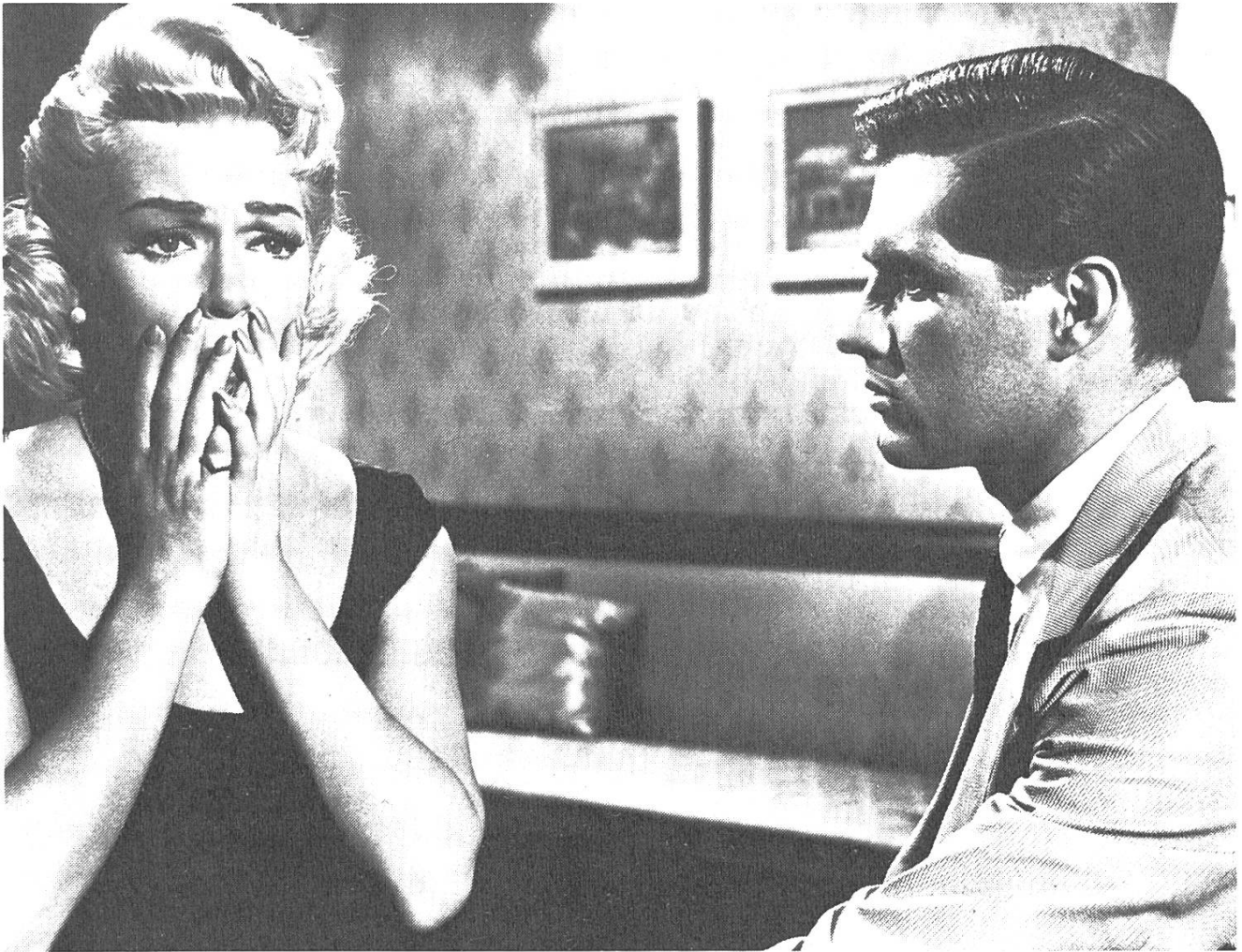
Douglas Sirks letzter Film: «Imitation of Life».

nen, um einen Platz an der amerikanischen Sonne erhaschen zu können. Alle Personen tappen wie Blinde aneinander vorbei, ihren Wunschträumen nacheilend. «Dieses verzweifelte Freischwimmen im bonbonsüßen Sirup des ‚american way of life‘ ist der verquälte Versuch von Eingeschlossenen.» Die Nachahmung, die Imitation wird zur Existenzgrundlage. Der Eingeschlossene «gerinnt zu Auftritten auf flauschigem Teppich, in modischen Sesseln und vor schimmernden Vitrinen. (Glänzende) Schönheit ersetzt den in Wirklichkeit verpönten Genuss. Das versagte Glück am Dasein flüchtet sich in ein Glück am Schein». (Wolfram Knorr). Der Film endet mit dem pompösen Begräbnis für Annie Johnson. Wenn Mahalia Jackson singt, dass sich die Menschen versöhnen sollen, so wirkt sie wie ein Fremdkörper in dieser kaputten Welt, sie wird zur letzten Verkünderin eines aufrichtigen Glaubens; doch kann auch sie die Welt nicht mehr ändern. Auch wenn sich Lora, Susie und Sarah Jane am Schluss wiederfinden und zu lächeln versuchen, ist dies die letzte der vielen Lügen. Aus diesem Lächeln wird nichts werden. Dies wird klar, wenn in der Schlusszene der Totenwagen vorbeifährt und vom Farbfilm nichts mehr übrig bleibt als ein schwarz-weißes Bild: Weiße Pferde ziehen einen schwarzen Wagen (mit silberweißen Verzierungen). Das Verbindende zwischen schwarz und weiss fehlt: Annie Johnson – sie hat von Einigkeit geträumt – ist tot.