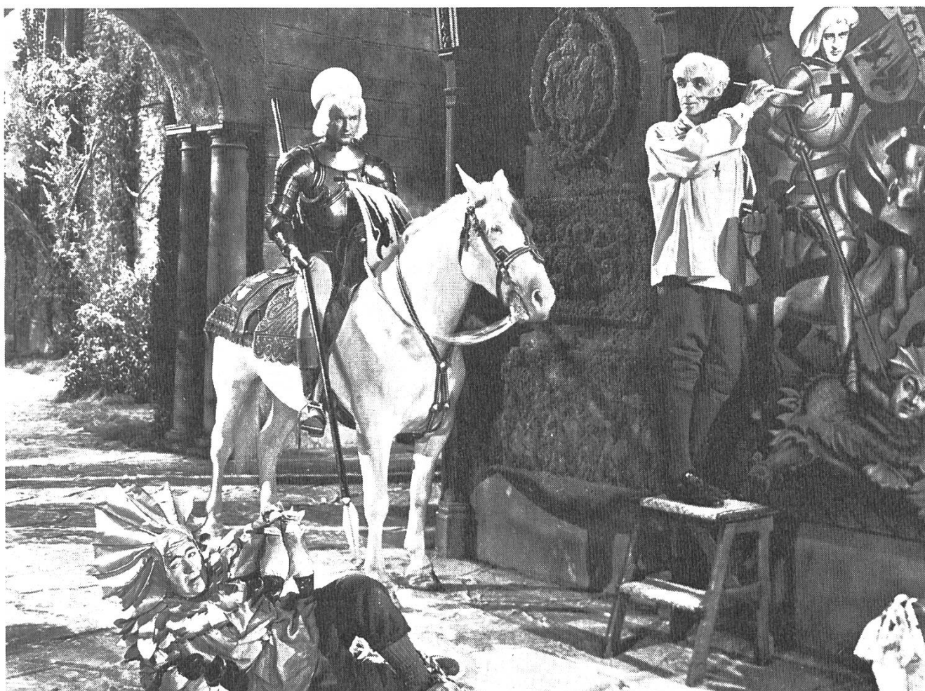
Aus «Scandal in Paris» .

Nach dem finanziellen Erfolg von «Magnificent Obsession» erhielt Sirk den Auftrag für «All That Heaven Allows» , einem ähnlichen Projekt, lediglich mit dem Unterschied, dass beim zweiten Film die Story eher vage ist und so einen grösseren Spielraum für die Regie offenlässt. Gerade das brauchte Sirk, um seine Ziele realisieren zu können. So wurde «All That Heaven Allows» stilistisch reichhaltiger und besser integriert. Er macht deutlich, wie stark Sirks Filme eine Synthese von Studioanforderungen und Eigenschöpfung darstellen; so konnte Sirk mit nicht selten eher mittelmässigen Drehbüchern äusserst aussagekräftige Filme entstehen lassen. «All That Heaven Allows» handelt von der Liebe zwischen Menschen zweier verschiedener Klassen, zwischen Jane Wyman, der reichen Witwe, und Rock Hudson, dem Gärtner. Mit ihrem Zusammentreffen prallen zwei Welten, zwei Gesellschaftsschichten aufeinander: die unbeschwerte Welt des Gärtners, die Natur, und auf der anderen Seite die verlogene Bürgerklasse von Jane Wyman. Auf den ersten Blick ist dieses Werk wieder eine Schnulze bewährten Musters, ein anpasserischer, süffiger Film. Doch unter der glatten Oberfläche sieht man Sirk, wie er am Lack des Glamours kratzt und wie dieser abblättert: eine in Auflösung begriffene Gesellschaft, keine offene Zersetzung, aber eine unterschwellige, innerliche Zerstörung. Hudson steht mit seinen Bäumen wohl für Amerikas Vergangenheit, mehr noch für dessen ehemaligen Ideale. Es sind