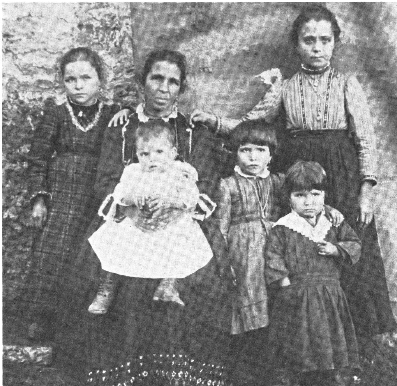
Aus «Emigration» von Nino Jacusso.

Der Film «Herbstblumen» hat am 6.internationalen Filmfestival Cinéstud 78 in Amsterdam den 1.Preis, den Publikumspreis, zugesprochen bekommen. Ich mag dem jungen Filmteam diesen Anerkennungspreis gönnen, doch frage ich mich, was den Ausschlag zu diesem Preis gegeben hat. Was mich besonders beeindruckt, ist die äusserst stimmungsvolle und stille Bildersprache. Dem jungen Kameramann Peter Indergand, der schon einige Super-8-Filme realisierte, ist es vortrefflich gelungen, die Grundstimmung dieser beiden jungen Männer mit der kargen Landschaft zu verbinden. Etwas mehr Mühe bereitet mir die Story. Allzuvieles bleibt da dem Zufall überlassen, zu durchschaubar ist das Schicksal der beiden Hauptdarsteller.