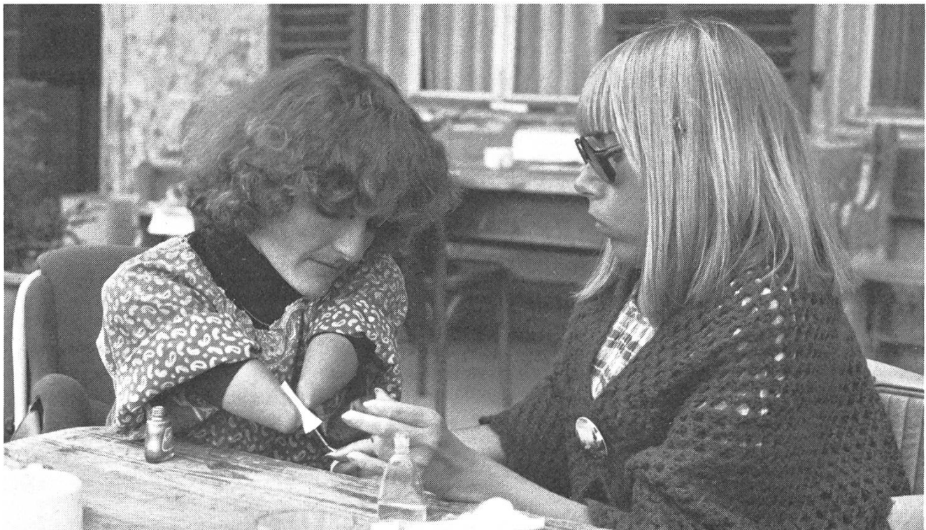
Einfühlsam und ohne falschen Ton: «Behinderte Liebe» von Marlies Graf.

Am Schluss des Films sieht man die Behinderten in den Saal eines Landgasthofes kommen, in dem zum Tanz aufgespielt wird. Die Behinderten und ihre nichtbehinderten Begleiter mischen sich unter die Tanzenden. Sie bewegen sich so ausgelassen, wie es ihnen möglich ist, sie lachen und scheinen zufrieden zu sein. Die Bewegungen der anderen, nichtbehinderten Tänzer wirken dagegen plötzlich sehr schwerfällig, ja verkrampft. Marlies Grafs Film entstand aus der Arbeit einer Selbsthilfeorganisation von Behinderten und Nichtbehinderten, die sich, mit dem Ziel, einen Film zu machen, während Jahren regelmässig getroffen und in langen Gesprächen ihre Situation in der Gesellschaft analysiert hat. Die Gruppe entschloss sich schliesslich im Film das Thema «Körperbehinderte – Beziehungen – Sexualität» zu behandeln. Durch die lange und intensive Vorarbeit der Gruppe und durch die unerhörte Geduld und das echte Verständnis, mit dem die Filmemacherin der Gruppe begegnete und sich ihr näherte, ist ein Film entstanden, in dem der Zuschauer vorerst einmal reagiert wie die Tanzenden im Landgasthof. «Behinderte Liebe» ist jedoch nicht nur ein Film, in dem Behinderte von ihren Schwierigkeiten sprechen und zei-