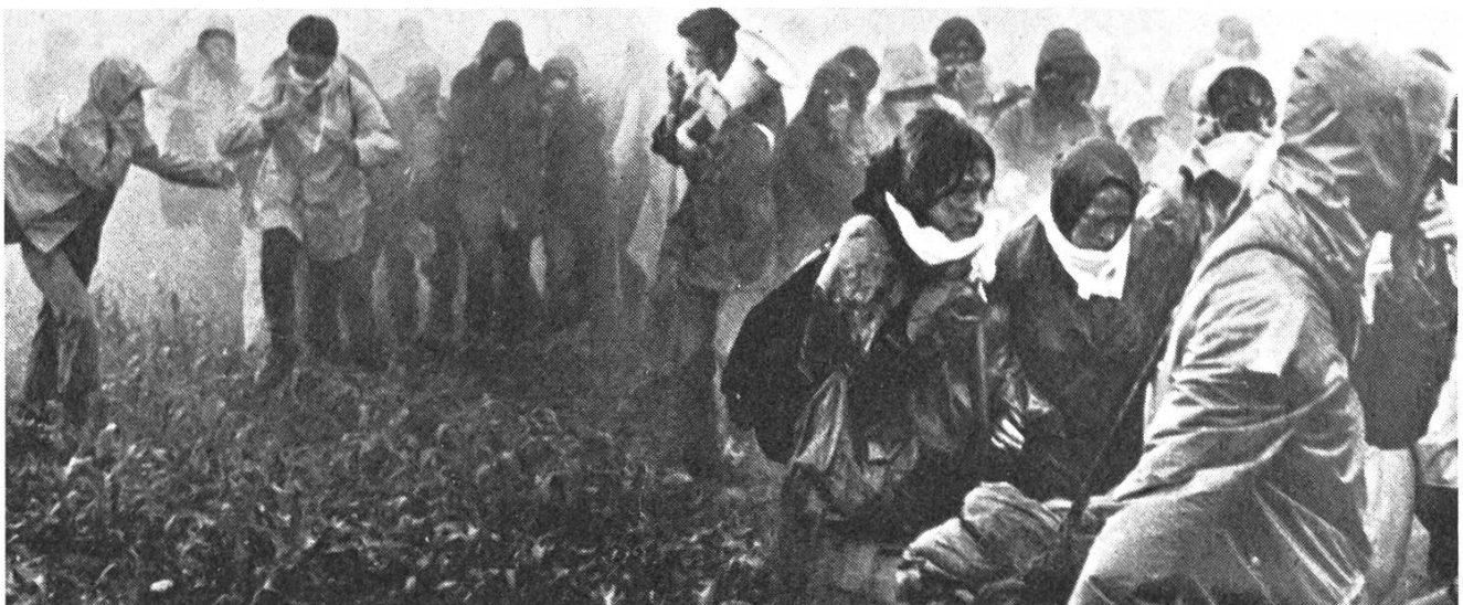
Auf Super-8 gedreht: «Gösgen» des Filmkollektivs Zürich.

«Gösgen» ist eine Selbstdarstellung betroffener AKW-Gegner, ihrer Motive und Handlungen. Der Film setzt sich nicht anhand von Argumenten mit der Energiefrage