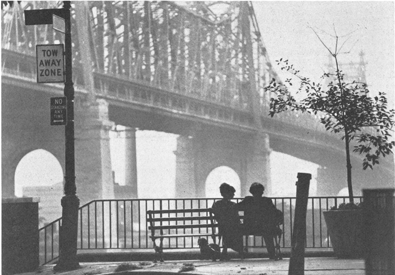
Aus „Manhattan“ von Woody Allen.

individueller Entwicklung lädt Francesco Rosi «Eboli» nach Carlo Levis 1945 geschriebenem Roman «Cristo si e fermato a Eboli» ein. Der seines Nonkonformismus wegen unter Mussolini tief ins Mezzogiorno verbannte Arzt, Maler und Schriftsteller Levi (eindrücklich verkörpert durch Gian Maria Volonté) führt den Zuschauer in eine unbekannte, ärmliche Gegend, deren Einwohner sich angesichts ihrer harten Lebensbedingungen im wahrsten Sinne von Gott verlassen vorkommen.