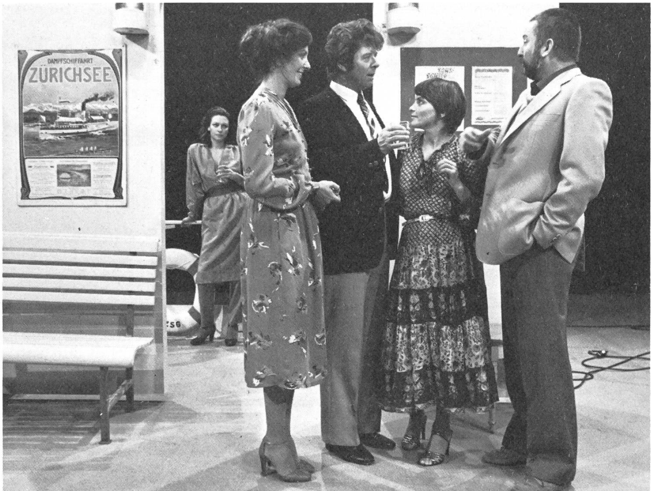
Kein Ort für Bekenntnisse: «Telearena» vom 7. November.

Im Gegensatz zum «Wer bin ich?» ist die Telearena ihrer ursprünglichen Konzeption nach (vgl. ZOOM-FB 17/79) ein Sendegefäß mit einem themenkonzentrierten Schwerpunkt. Bei früheren «Telearena»-Sendungen, zum Beispiel über Atomkraftwerke oder über die Homosexualität, standen lebendige, thematische Auseinandersetzungen im Mittelpunkt. Bei der Diskussion prallten Interessen und Meinungen aufeinander. In einer Art Bürgerdebatte wurde mit Argumenten und Polemiken gestritten. Es ging um Probleme unserer Zeit, um Probleme mit einer ausgesprochen