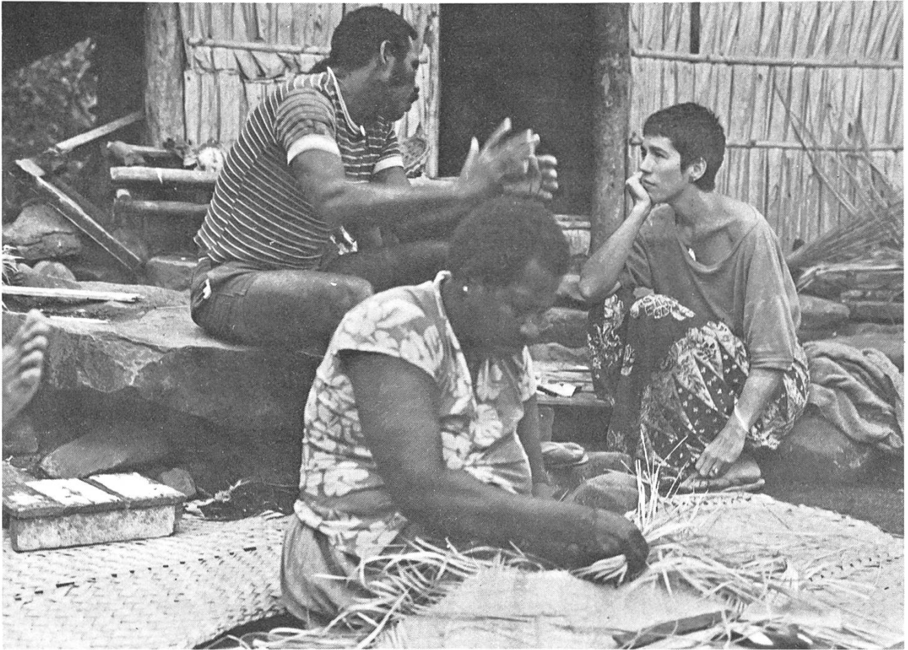
Der gescheiterte Versuch eines dokumentarischen Spielfilms: «Beschreibung einer Insel» von Rudolf Thome und Cynthia Beatt.

lich intensiver Film. Viele Szenen scheinen tatsächlich authentisch zu sein, wie ein Dokument packend durch das, was und wie es zur Sprache kommt. In Themen und Abläufen erkennt man sich da selber wieder, auch wenn wirklich Intimes nur wenige Male angedeutet wird. Diese Distanziertheit gab allerdings oft das Gefühl, zum platten Klischee sei's nur ein kleiner Schritt – der in einigen langweilig heruntergeleiterten Passagen auch getan wurde. Daran mag auch schuld sein, dass Kommunikation hier aufs Wort beschränkt blieb: Durchwegs vermisst habe ich jene kleinen Gesten und Blicke, mit denen sich Leute, die schon lange zusammen sind, schneller und besser verstehen als über pausenloses Gerede.