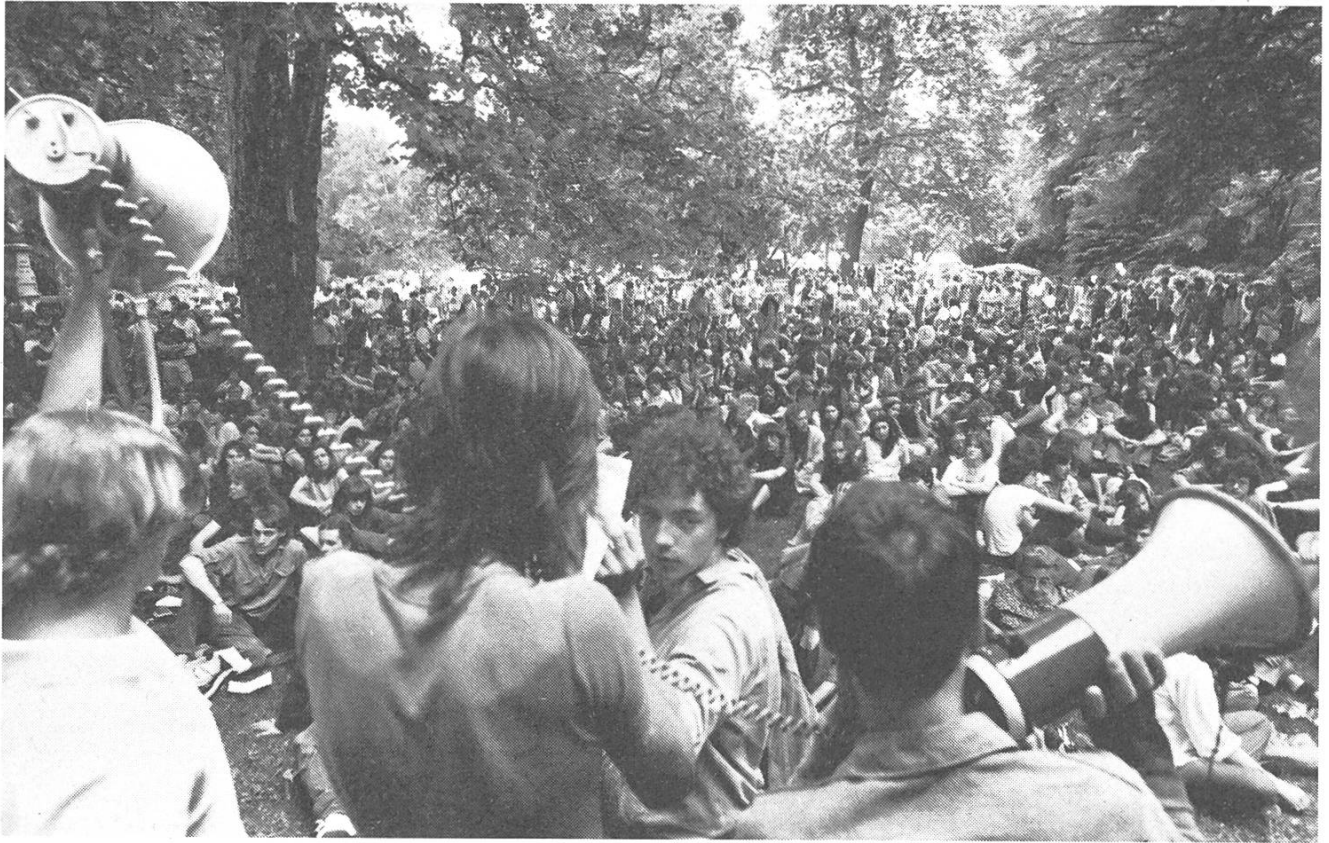
Eine junge Generation sucht sich zu artikulieren: Vollversammlung auf dem Platzspitz in Zürich.

mich. Sie gehen mich etwas an – nicht so sehr (sicher auch), weil die Demonstrationen in Zürich, also eigentlich vor der Haustür stattgefunden haben, und die tödlichen Schüsse irgendwo in der Fremde losgingen, sondern weil in den Bildern einer zwanzigjährigen Geschichtsstudentin zwischen Polizisten in Kampfausrüstung mehr zu spüren ist von der Gewalt und der Angst, die Menschen in extremen Situationen erfassen kann, als in den Bildern aus San Salvador.