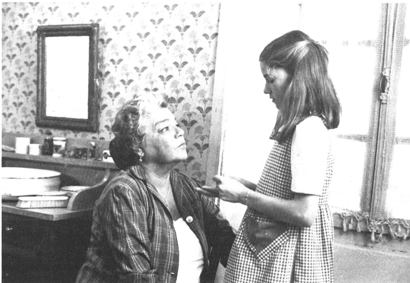
Simone Signoret (links) als Grossmutter, die alles weiss und alles versteht.

achten. Verliert sie ihn einmal aus den Augen, so lungert sie mürrisch und abweisend im und um das Haus der Grossmutter herum, wobei sie sich deren mitfühlendem Verstehen zwar nicht ganz entziehen kann, sich aber auch ihrer Mamie nicht offenbaren mag. Schliesslich fasst Marie – nachdem sie längst, was im kleinen Dorf nicht schwerfiel, mit dem jungen Arzt bekannt wurde – den Entschluss, sich und auch Alexandre ihre Verliebtheit einzugestehen. Als sie jedoch vor ihm steht und mit geschlossenen Augen den ersten Kuss des Geliebten empfangen will, muss Marie erfahren, dass sie noch für ein Mädchen gehalten wird.