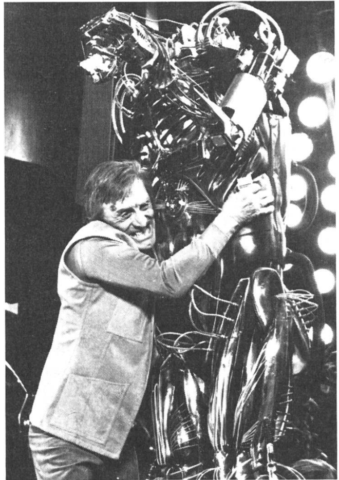
Kirk Douglas' Kampf mit dem Roboter Hector in «Saturn 3» von Stanley Donen.

klassischen Horrorfilmthemas vom künstlichen Menschen, der sich der Kontrolle seines Erbauers entzieht. Trendgerecht in einer fernen Zukunft, auf einem fernen Planeten und in futuristischem Dekor spielend, werden mit der alten Mär neue, zeitgemässe Motive verknüpft, wie zum Beispiel die Furcht des modernen Menschen, von der Technik überrollt zu werden. Daher ist Hector ein Roboter, ein technisches Wunderwerk und besteht nicht wie der Golem aus Lehm oder wie Franksteins Monster aus Leichenstücken. Seine Existenz bedroht Adams Dasein auf Saturn 3, läuft Adam ja Gefahr, wegrationalisiert zu werden. Doch die Vision des Filmes zielt noch weiter. Dadurch, dass James dem Roboter seine Gefühle und sexuellen Begierden überträgt, macht er ihn zu einem Rivalen auch auf dieser letzten, dem Menschen noch vorbehaltenen Domäne. Und aufgrund seiner übermenschlichen Kräfte