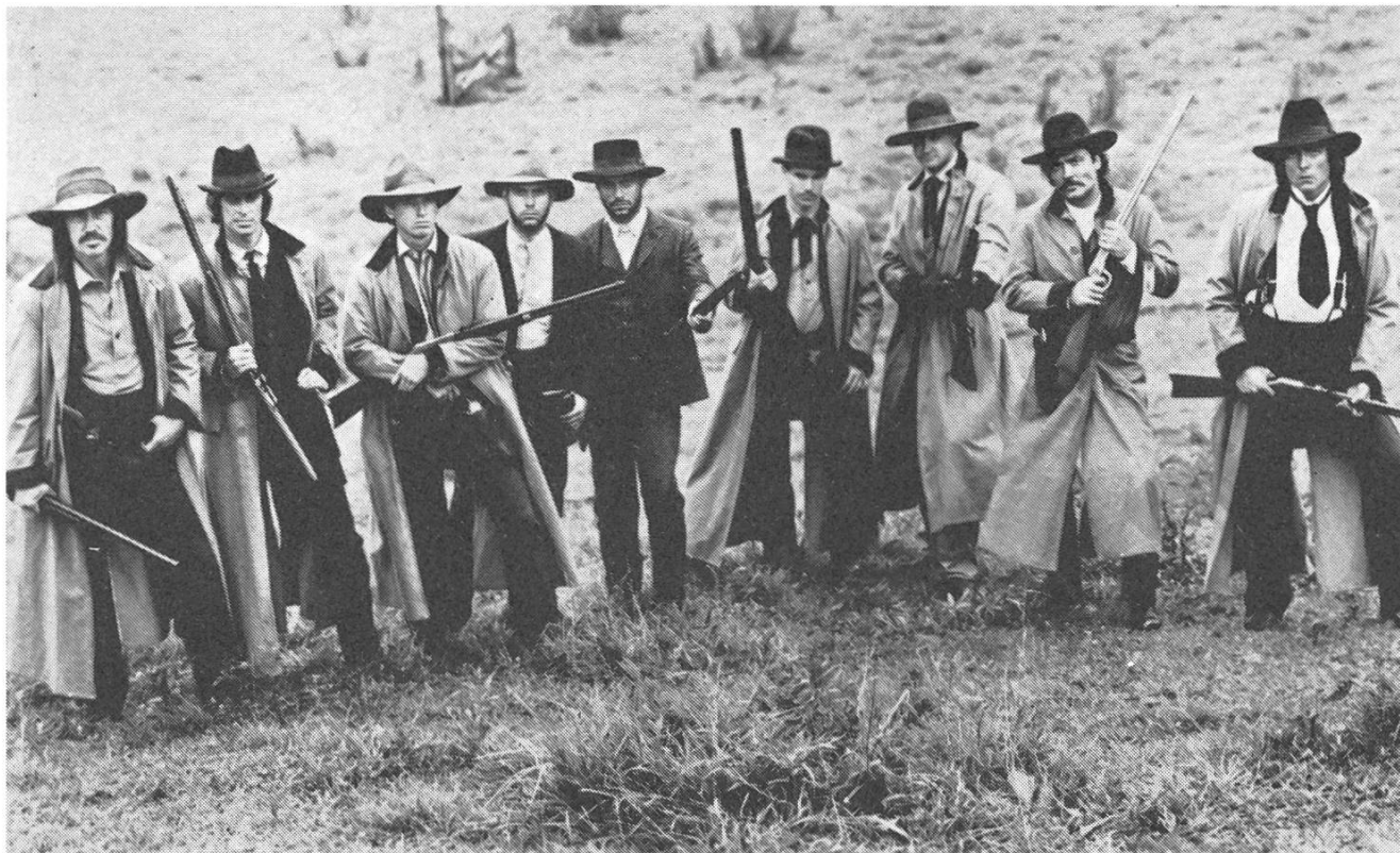
Die Outlaws der Jesse-James-Bande: Robin Hoods der amerikanischen Südstaaten.

dem er seine Story mit sozialkritischem Touch anzuheben versuchte. Die dadurch entstandene operettenhaft-gespreizte Sozialschnulze enthüllte die Mängel, die Hill durch die sich ständig jagenden Aktionen seiner beiden ersten Filme eliminieren konnte: die Unfähigkeit zu einer psychologisch fundierten Figuren-Darstellung. In «The Long Riders», seinem ersten Western, bleibt er zwar seinem Thema treu – dem Verhältnis zwischen Verfolgern und Verfolgten und der Eskalation von Gewalt – doch gesellschaftskritische Ambitionen spürt man eben auch, die – gemessen an der Gewaltsteigerung – hohl und in den Dialogen oft unfreiwillig komisch wirken.