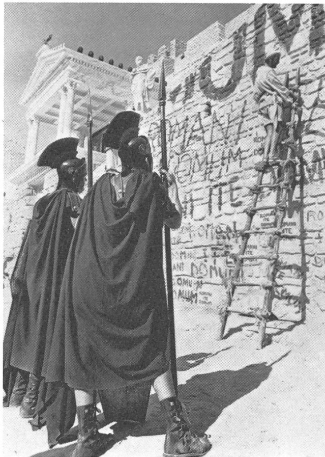
Der «Sprayer» von Jerusalem.

Ich kann mir jedenfalls sehr gut vorstel-