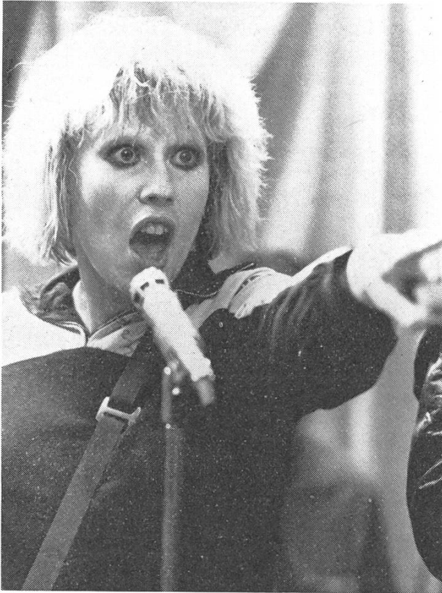
Punk-Sängerin Kate (Hazel O'Connor) zerbricht an der Vermarktung ihres Protests.

störrisch, mal zärtlich und verletzlich über ein breites Register verfügt.