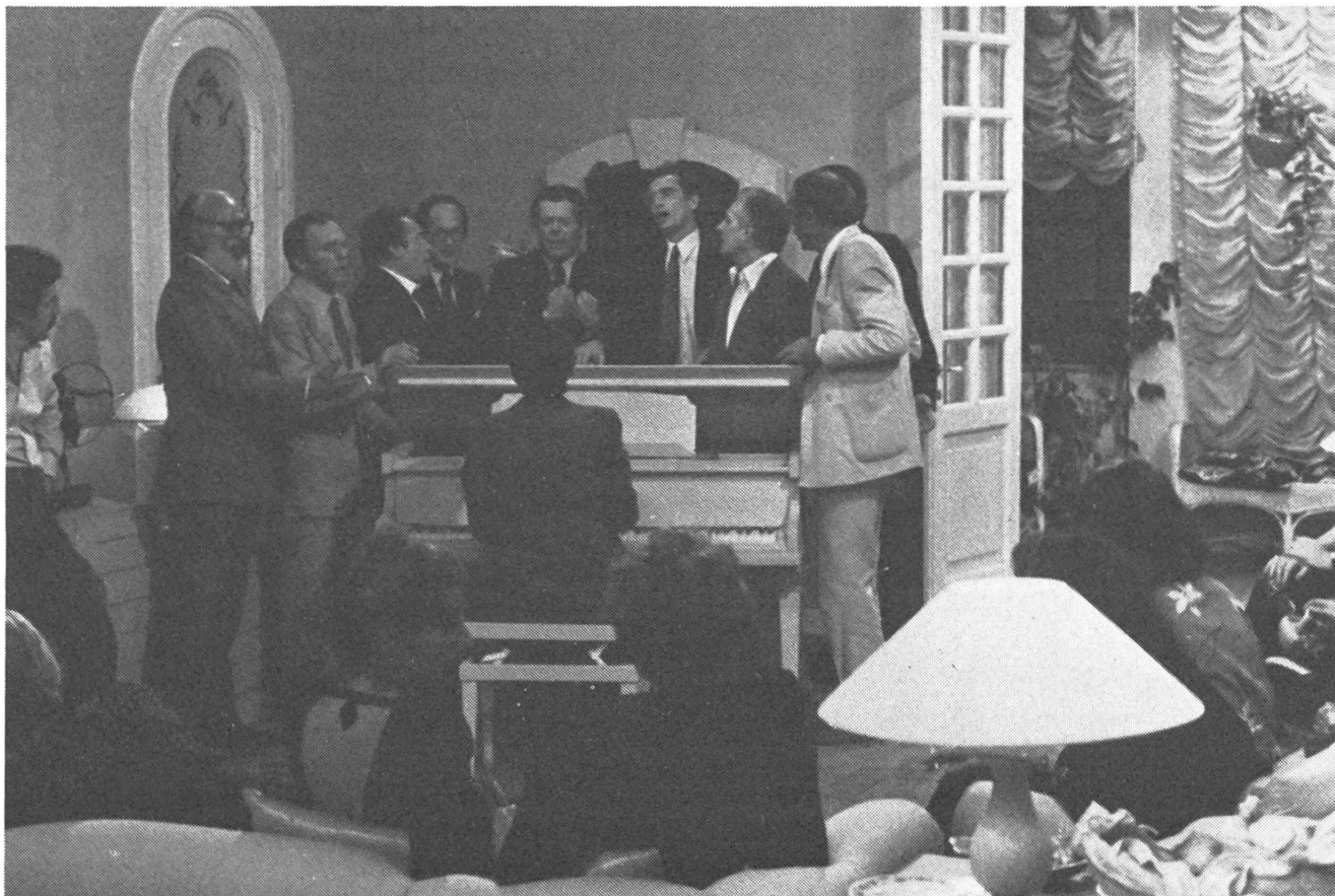
Abgetakelt und rückwärts gewandt: Midlife-Crisis der Männer.

ger beteiligt sich Sergio nicht an den geistreichen Selbstbeziehungstiraden seiner Freunde – er handelt.