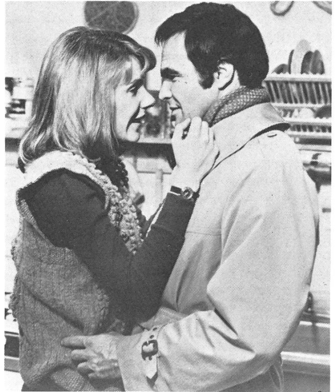
Burt Reynolds und Jill Clayburgh.

«Starting Over» ist eine «heiter-besinnliche Komödie um einen (entheirateten) Mann» (Tages-Anzeiger Kinoreklame vom 30. 8. 1980) und darf es sich deshalb erlauben, mit Klischees aufzuwarten. Und der Klischees sind viele in diesem Film: Der Mann zum Beispiel, der die Fäden in der Hand hat, alles renkt und lenkt, wie er es will. Burt Reynolds, der, wie er in einem «Playboy»-Interview