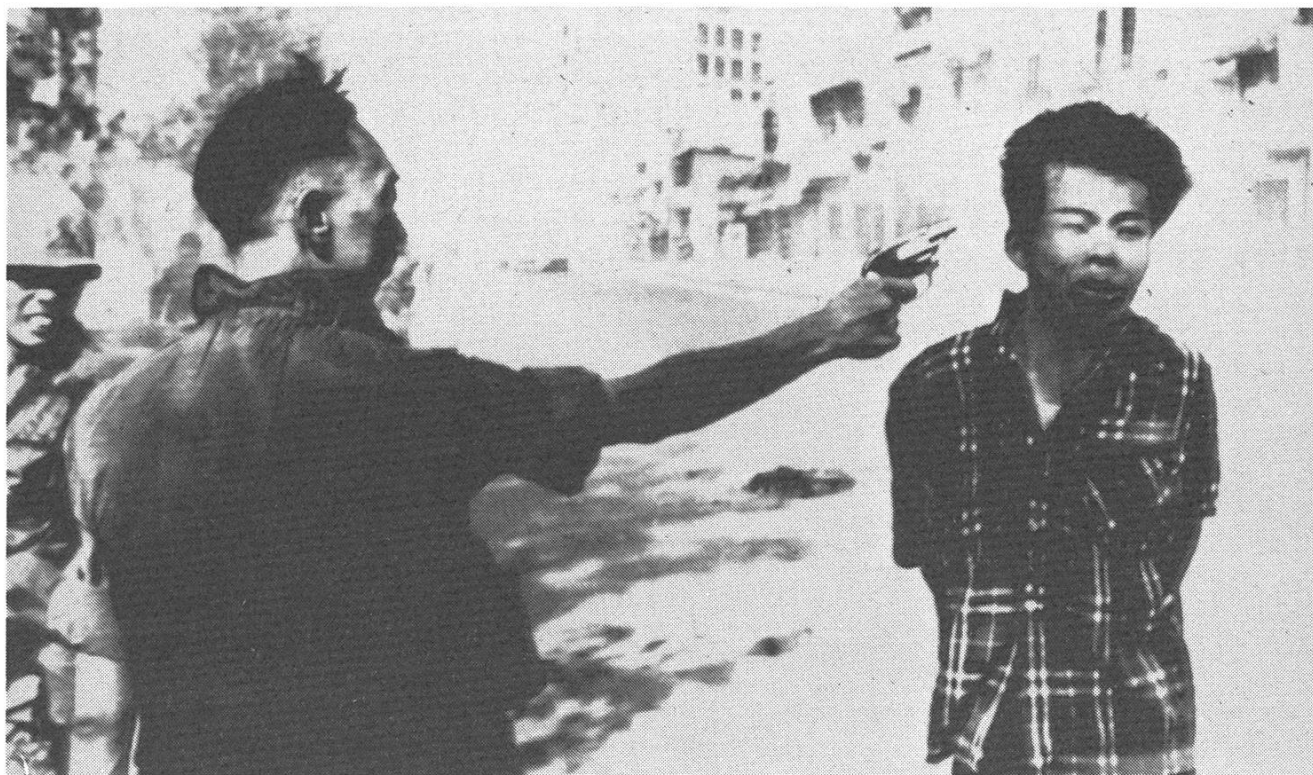
Pulitzerpreis-Foto als Alibi für brutale Sensationsmache in den Medien?

immerhin lapidar durchblicken, dass die leicht verderbliche Ware Nachricht und die Konkurrenzsituation Einfluss auf die Gestaltung habe. Im Nebel fadenscheiniger Beschwichtigungen mit dem journalistischen Auftrag, ging das Argument unter. Greulich hakte nicht nach. Ethische Verantwortung, vernünftige Einschätzung des Informationswertes brutaler Bilder, von Kenntnissen und der Beachtung konkreter Rezipientenreaktionen und Ergebnissen der Wirkungsforschung ganz zu schweigen, vermischte der Zuschauer bei den Chefs. Diese Herren glauben mit harten Bild-Drogen die «Realität» abbilden zu können; ein Armutszeugnis für das Reflexionsniveau der Grossauflagen-Ritter kolorierter Hochglanz-Werbeträger.