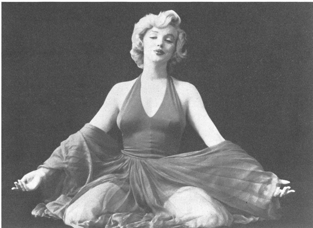
Die Gefahr des «Sich-selbst-Verzehrens» tritt dann ein, wenn die repräsentierte Besonderheit der Darstellerin stereotyp vermarktet wird. Marilyn Monroe in «The Prince and the Showgirl» (1957).