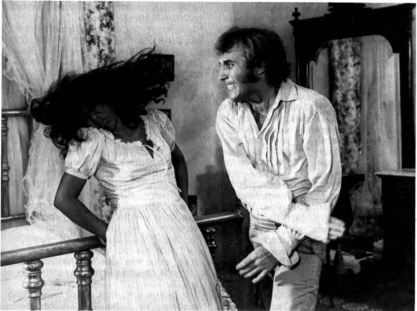
«El otro Francisco» von Sergio Giral (1975).

freies Filmschaffen ist schon deshalb nicht möglich, weil filmtechnische Geräte und Rohmaterial nicht frei käuflich sind), sind der themenmässigen Vielfalt keine Grenzen gesetzt. Das betonte die Delegation kubanischer Filmschaffender, die anlässlich der Filmvorführungen in der Schweiz weilte. Ein Filmprojekt wird vom Filminstitut begutachtet und je nachdem finden Diskussionen zur Beilegung eventueller Unstimmigkeiten statt. Film, so wurde hervorgehoben, entstehe in Kuba in der Folge eines starken Kollektivdenkens. Trotz dieser aus kubanischer Sicht positiv erscheinenden Tatsache tritt die Monopolisierung des Filmwesens hin und wieder in Erscheinung – bedauerlich, aber unvermeidlich.