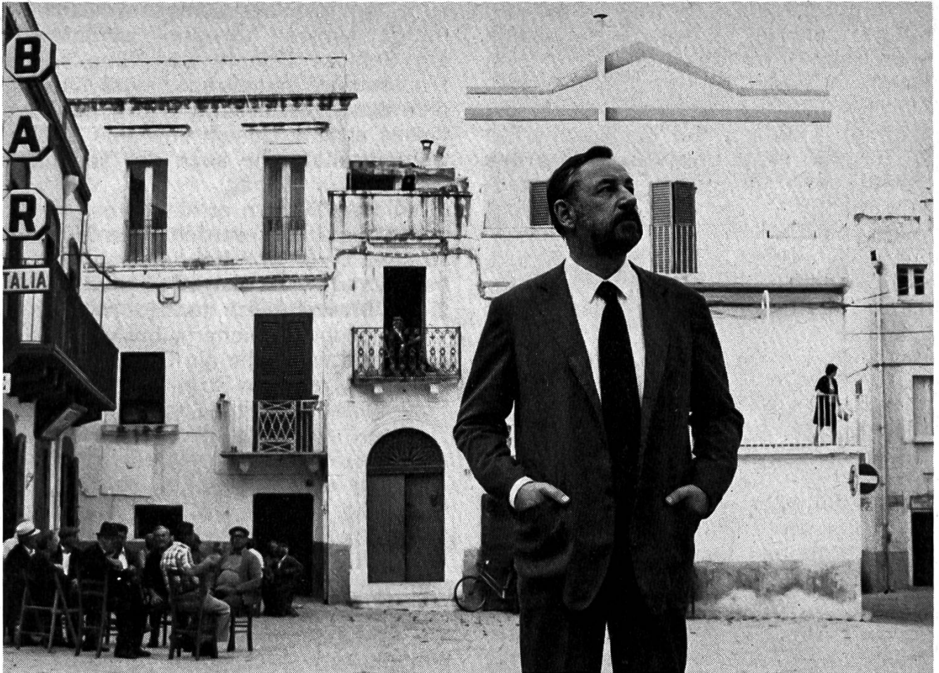
Philippe Noiret als Raffaele in Francesco Rosi «Tre fratelli».

nung. Im gemeinsamen Schmerz öffnen sie sich einander, schenken sich gegenseitig Vertrauen und zärtliche Liebe. Es wird eine Brücke geschlagen zwischen Donato und Marta, zwischen Vergangenheit und Zukunft. Nicht bei den resignierenden Brüdern, sondern in dieser Beziehung zwischen dem alten Mann und dem kleinen Mädchen scheint Rosi Hoffnung zu liegen – in einer zutiefst menschlichen Dimension der Liebe, Zärtlichkeit, Geborgenheit und Solidarität.