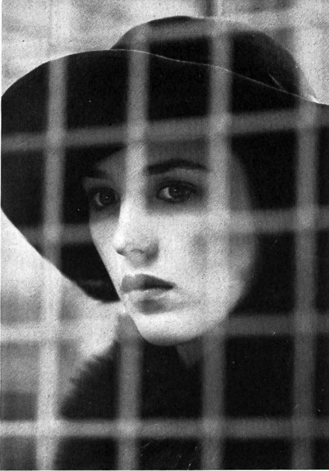
Die schöne Maria (Isabelle Adjani) gerät in schlechte Gesellschaft.

von Jean Rhys aus den zwanziger Jahren, schildert eine Geschichte aus einer schlimmen Zeit. Schauplatz des Geschehens ist das Paris der Zwischenkriegszeit. Nach aussen hin tragen die Angehörigen der «haute société» eine saubere Weste, doch in ihren Hinterzimmern spielen sich die schlimmsten Sachen ab. Da wird geheuchelt, gelogen und intrigiert was das Zeug hält. Ein jeder will mit jeder gleich ins Bett gehen, ein jeder säuft und raucht und snifft Kokain, dass es schlimmer nicht geht. In der schummrigen Atmosphäre zweifelhafter Lokale strippen Mädchen vor den Augen eines konsumsüchtigen Publikums. Und ein geschäftstüchtiger Fotograf schießt in seinem Atelier Pornofotos, wie sie heute noch nicht einmal der «Playboy» veröffentlicht.