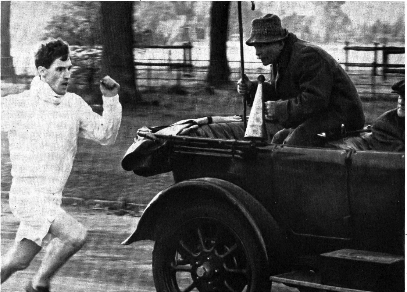
Ben Cross als Sportler Harold Abrahams und Ian Holm als Trainer Sam Mussabini.

mit dem festlichen Essen. Beim College Dash, dem Wettlauf um den Innenhof während der zwölf Schläge der Turmuhr, den Abrahams seit Menschengedenken als erster schafft, ist ihm der junge Lord Andrew Lindsey (Nigel Havers) dicht auf den Fersen: ohne Vorbereitungen, lässig hinzuschlendernd, noch mit der Zigarette zwischen den Fingern. Eine Konfiguration eleganter Anstrengungslosigkeit und Erfolgsgewohnheit, die dem Juden Abrahams immer wieder zu schaffen machen wird. Doch wir greifen vor.