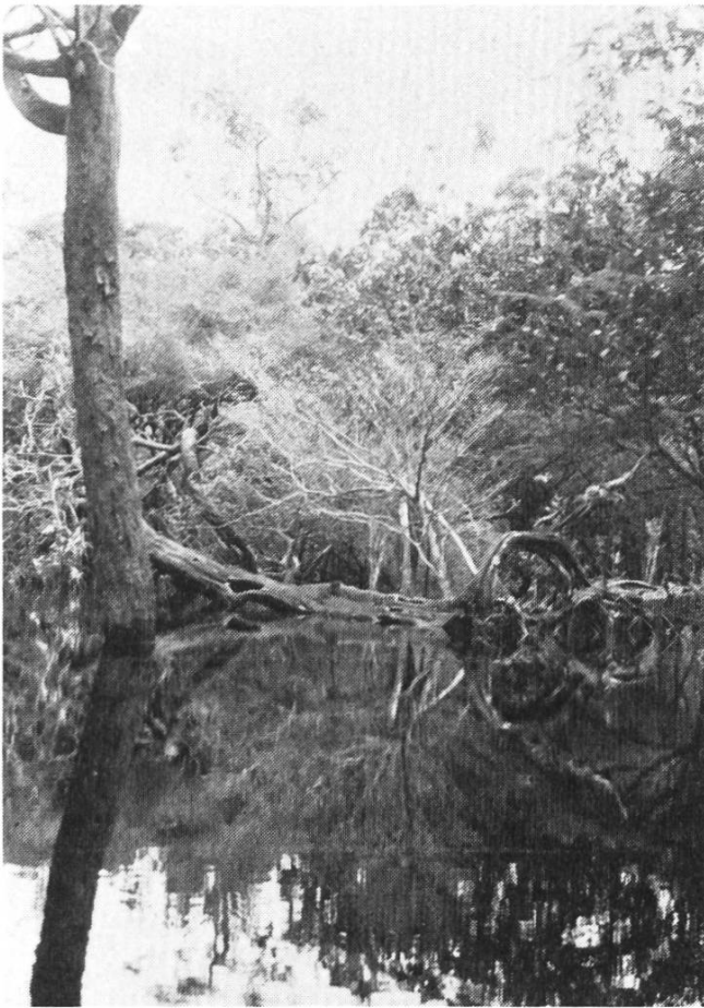
Mit der Zerstörung der Natur wird auch der Mensch bedroht.

Der zweite Teil des Features wendet sich dem vitalen brasilianischen Leben in den grösseren Städten zu. Die aus einer Vermischung von afrikanischen, europäischen und indianischen Eigenheiten entstandene Kultur wird durch eine Steigerung vorgeführt: Sie beginnt in den kleineren Ortschaften mit ihren echten zwischenmenschlichen Beziehungen. Musik und immer wieder Musik. Kneipen und öffentliche Plätze sind die Bühnen. Die letzte Station ist Rio. Touristen werden hörbar, Filmkameras surren; wir befinden uns wieder in einer Zivilisation, die uns bekannt ist. Nach Eindrücken von hektischen Strassen, von Armenvierteln und vom betörenden Nachtleben dieser Millionenstadt tritt am frühen Morgen, vor dem Sonnenaufgang, in unscheinbarer Ruhe die Natur nochmals an uns heran: Das Meer rauschen lässt die Reise ausklingen. Vielleicht ergibt sich beim Anhören von «Brasil» ein ähnlich faszinierendes Ge-