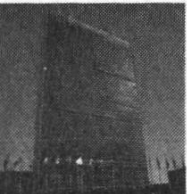
United Nations Headquarters, New York City

The UN was planned originally as a practical, collective postwar forum from which to mobilize against future aggression. Today a UN majority comprised mainly of unfree and partially free societies has transformed that body into one which