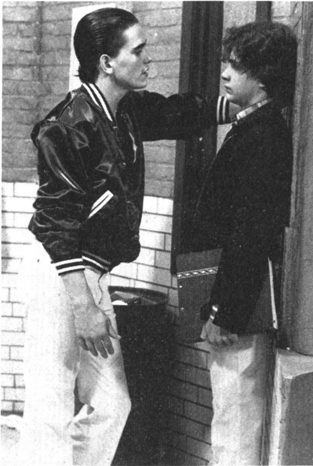
Hackordnung im Schulhof: «My Bodyguard» von Tony Bill.

sammen: Ricky hat sein Motorrad aus dem Wasser gehoben und trifft, nachdem ihn Clifford gesehen hat, erneut auf Moody und seinen Leibwächter. Diesmal schlägt, wie aus Erfahrung klug geworden, auch Linderman zu. Ricky besiegt den Leibwächter und Clifford den pomadigen Moody.