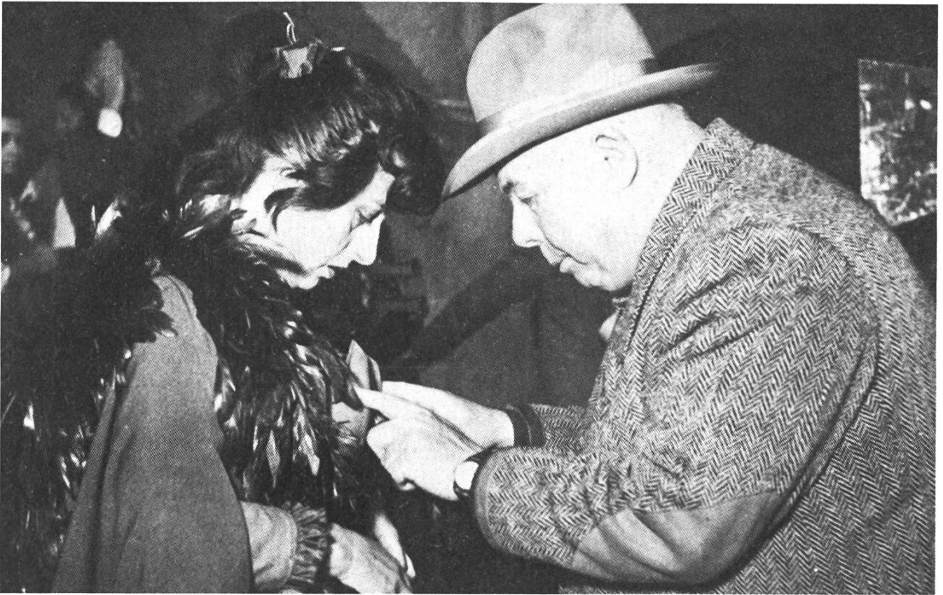
Anna Magnani und Jean Renoir bei den Dreharbeiten zu «La Carrozza d'Oro».

dell'Arte-Truppe auf, die mit dem selben Schiff wie die Kutsche voller Hoffnung aus Europa herübergekommen ist, um «in dieser märchenhaften Neuen Welt ihr Glück zu machen», folgt dieser Komödiantentruppe, die im Gasthof des Nestes ihr «Theater», einen heruntergekommenen Hinterhof, in dem die Hühner gackern, übernehmen, herrichten und ihr Spiel eröffnen wird. Die Kamera wird, wenn der Vorhang aufgeht, auch auf und hinter diese Bühne fahren, schliesslich sogar hinter den Vorhang dringen, der Colombine als Garderobe dient – und die Kamera wird selbstverständlich auch den ganzen Weg zu ihrer Ausgangsposition, vor den (allerersten) Vorhang in den Zuschauerraum – sprich: Kino –, zurückfinden.