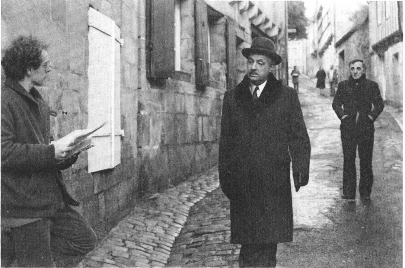
Vom Bösen unwiderstehlich angezogen: Charles Aznavour folgt Michel Serrault.

Wetter Labbé folgend, geholt hat. Der Hutmacher besucht den Todkranken und beichtet die Morde. Katchoudas Tod beendet das Spiel des Hutmachers. Es besteht auch kein Grund mehr zu weiteren Morden; denn die Freundinnen seiner Frau sind alle umgebracht. So allein gelassen mit seinen Phantomen, lockt Labbé, jetzt erst richtig verrückt, seine Haushälterin zu sich, um sie zu erwürgen, und auch Berthe, die Prostituierte, die Kindheitsgespielin, wird zu seinem – letzten – Opfer. Neben der Toten schlafend, wird er aufgefunden.