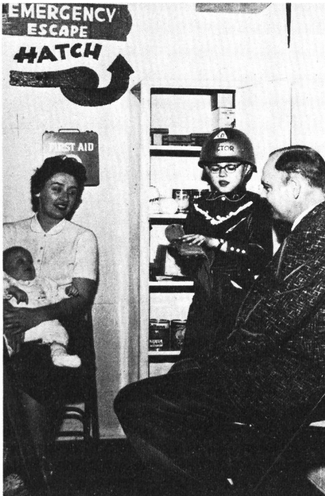
Familienidylle im Bunker, Vorstellung des amerikanischen Zivilschutzes in den 50er Jahren.

ches Vorwissen können deshalb viele Zusammenhänge nicht erkannt werden, und die tragischen Aspekte einiger Filmszenen kommen kaum zum Tragen. So wirkt es z. B. recht komisch und erheitend, wenn man den Soldaten zuhört und zusieht, die in den fünfziger Jahren bei den Atomversuchen in der Wüste von Nevada über das bevorstehende Ereignis sinnieren und sich in die scheinbar sicheren Schützengräben (!) begeben, um von dort aus die Explosion live und in unmittelbarer Nähe mitzuverfolgen. Ein Priester in Uniform erzählt einem der Soldaten gar von der einmaligen Schönheit einer Atomexplosion, welche er schon mehrfach miterlebt habe. Nach der erfolgten Zündung verlassen die Soldaten die Unterstände und gehen auf den harmlos aussehenden Riesenpilz zu. Bilder, die aus einer Satire stammen könnten und heute ein Lachen provozieren, ein La-