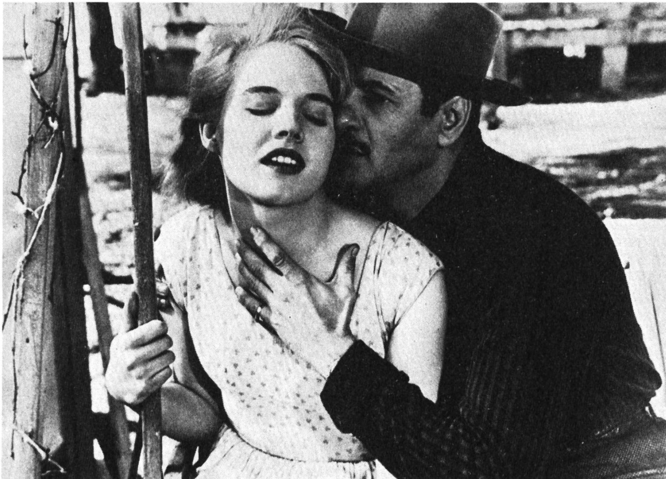
Carroll Baker als Baby Doll und Eli Wallach als Silva Vacarro.

det. Sinnlichkeit und Erotik dienen ihm nur als Mittel, sich an Archie Lee zu rächen.