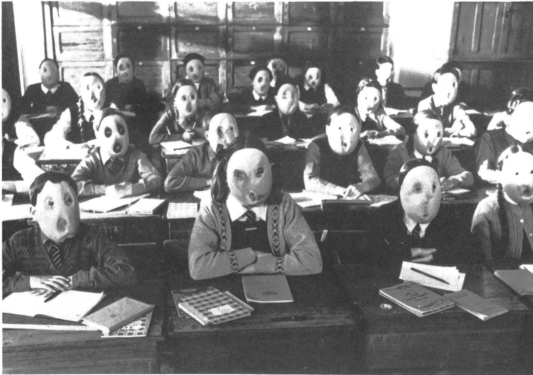
Auf der Leinwand sehen und erleben, was zuhause im Plattenschrank steht: aus «The Wall» (links) und «Saturday Night Fever».

Rapper, Scratcher, Sprayer und Breakdancer einen Ausstoss an Breakdancefilmen bewirkt (« Breakin'-The Movie », « Beat Street »), die wiederum Breakdance zu einem Volkssport und den Rappesang hoffähig machten.