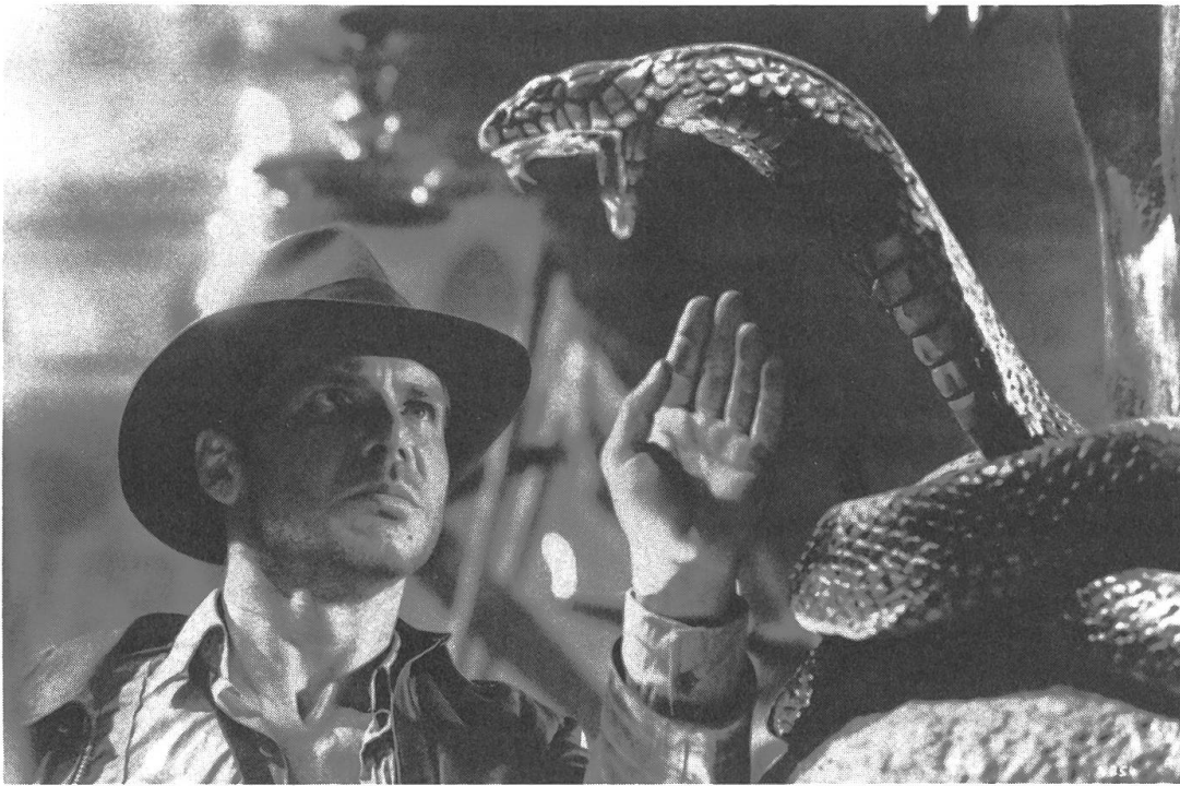
Die coolen Helden unserer Tage: Harrison Ford als Indiana Jones.

unendliche Geschichte » (ZOOM 8/84), «The Dark Crystal» ( Der dunkle Kristall ) signalisieren mit ihren mythischen, märchenhaften Aspekten und Wahrheits-Äusserungen die Sehnsucht nach Harmonie, Liebe, Ruhe und den Wunsch nach einem paradiesischen Zustand.