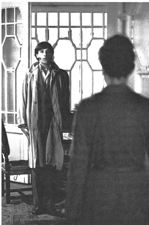
Pelle, der ungebetene Gast, steht vor der Tür: «Requiem» von Zoltán Fábri.

Handlung: Budapest. Ungarn steht unter der Diktatur des stalinistischen Parteichefs Mátyás Rákosi. Die 1949/50 erfolgten Verhaftungswellen bilden den äusseren Rahmen der Geschichte. Ohne dass die Vorgänge dieser Jahre im Film eine breite Darstellung erfahren, lassen sie sich doch unschwer aus dem Geschehen herauslesen. Fábri veranlasst den Zuschauer, mit oft aus den verschiedenen Blickwinkeln der Protagonisten gegengeschnittenen Rückblenden, politische und zwischenmenschliche Beziehungsgeflechte wahrzunehmen.