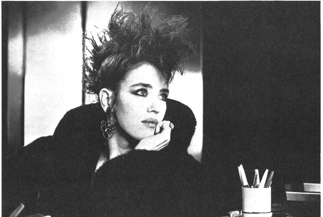
Isabelle Adjani in Luc Bessons «Subway», einem Märchen aus dem Video- Clip-Zeitalter.

dachtes Transportsystem: die Untergrundbahn.