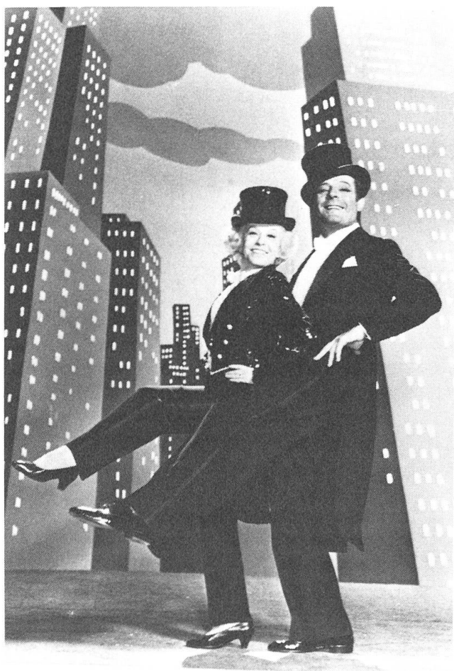
Ein Tanzpaar (dargestellt von Marcello Mastroianni und Giulietta Masina), das früher nach grossem Vorbild mit Steppen durch die Varietés tingelte, soll nach 30 Jahren noch einmal in einer TV-Show auftreten. Das Fernsehstudio wird zum exemplarischen Ort einer sich selber zerstörenden Gesellschaft.

sich vom Schönheitschirurgen so oft operieren liess, bis sie überhaupt kein Gesicht mehr hatte. Und für das Leben aus zweiter Hand werden selbstverständlich noch mehr Doppelgänger herbeigeschafft: Bette Davis, Marlene Dietrich, Liza Minelli, Tarzan, Papst Pius XII. Kantine und Schminkräume werden zu Jahrmärkten der Eitelkeiten, und durch die Korridore zieht ein endloser Korso mit Operndiven, Muskelmännern, Schimpansen, Schwimmerinnen und Musikern. Eine Halb- und Scheinwelt ist in Bewegung geraten, wird umgerührt im brodelnden Topf des Fernsehens, aufgeköcht, um schliesslich der staunenden Masse als Fastfood der Illusionen auf dem Bildschirm serviert zu werden.