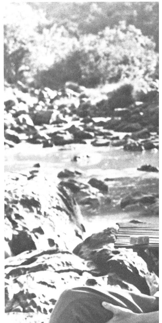
Kolonialromantik vor spektakulärer ostafrikanischer Kulisse: Meryl Streep und Robert Redford in Sydney Pollacks «Out of Africa».

Für die Rolle der Blixen wählte Sydney Pollack Meryl Streep. Sie spielt die initiative energische Farmerin, die sich in einer gnadenlosen Welt durchzusetzen versteht. Dieser Stil liegt der Schauspielerin nicht besonders, möglicherweise weil man sich bereits ein Bild von ihr gemacht hat, nämlich das der verträumten Frau eines erfundenen französischen Leutnants oder einer verliebten amerikanischen Mittelstandsmutter. Die Kunst der langen Blicke, die auf tiefes Wasser schliessen lassen, kann sie in ihrer Beziehung zu Finch Hatton – ihn spielt Robert Redford – naturgemäss am besten ausspielen. Aber die Zweisamkeit ist nicht allein das Ent-