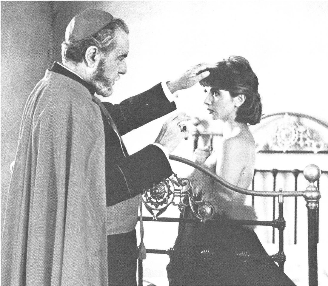
Taufszene im Bordell: Victoria Abril und Fernando Rey in «Padre nuestro».

und «die Kardinalin» genannt wird, und seiner kleinen Enkelin Maria (Emma Penella). Ein braver Hirte hatte damals die verlassene Mutter geheiratet, hatte sie wieder ehrbar gemacht und spielte würdevoll die Rolle des Ehemannes, des Vaters und Grossvaters. Die Ankunft des Kardinals befleckt seine Ehre und seinen Stolz: Der Hirte stürzt sich in einen Ziehbrunnen und ertrinkt.