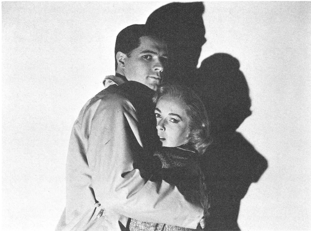
Subtilität der angsterzeugenden, filmischen Mittel: John Gavin und Janet Leigh in «Psycho» von Alfred Hitchcock.

technisch immer noch brillant gemachtes Melodram vorstellt, in dem Kong die einzige Figur ist, mit der wir uns identifizieren können.