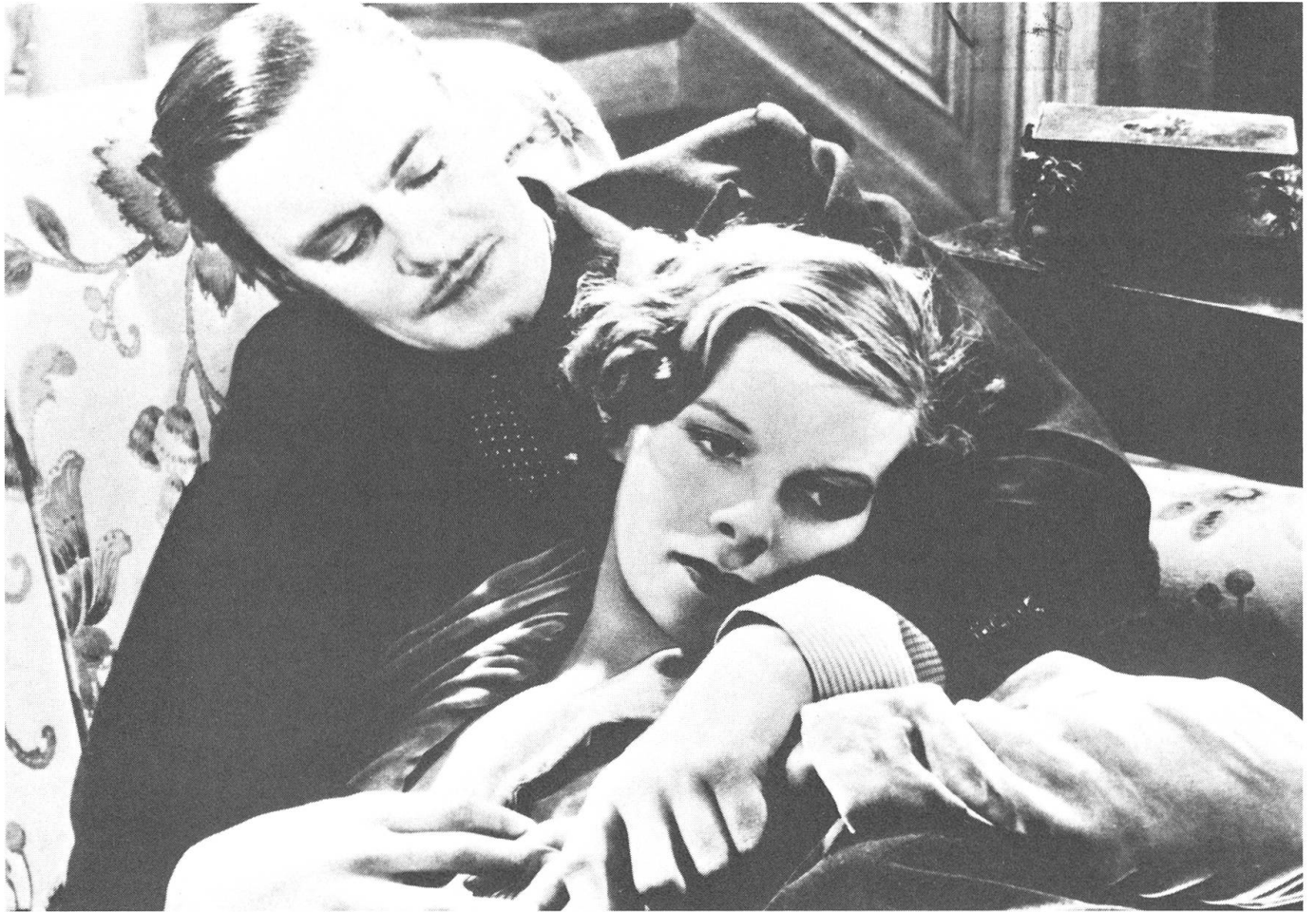
Katherine Hepburn in «Christopher Strong»: Sprengung des den Frauen zugewiesenen gesellschaftlichen Rahmens.

als unabhängige Frau kaum identifizieren konnte. Doch der jungen Regisseurin ging es nicht in erster Linie um die Inhalte ihrer Filme, denn auf die Auswahl der Drehbücher hatte sie ja ohnehin wenig Einfluss. «Manchmal glaube ich, dass Stolz das grösste Hindernis für den Erfolg ist. Dummer, falscher Stolz, das hält die Menschen davon ab, etwas lernen zu wollen, von ganz unten anzufangen, und bei jedem Schritt auf dem Weg nach oben etwas dazulernen. Als ich anfang, im Studio zu arbeiten, nahm ich meinen Stolz, knetete ihn zu einem hübschen kleinen Ball und schleuderte ihn zum Fenster hinaus». So schilderte Dorothy Arzner Ende der zwanziger Jahre einer Freundin ihr Regie-Debut.