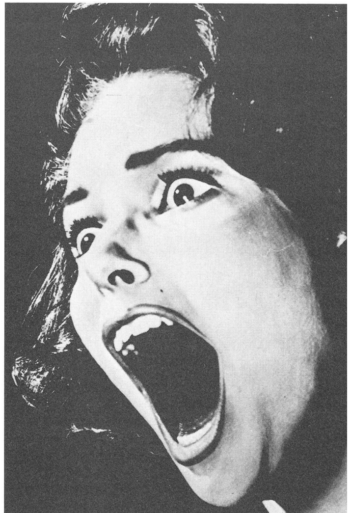
Grossaufnahme macht die Angst vor der Gewalt plastisch. Aus «The Taste of Fear» von Seth Holt.

Diese Kombination von Einstellungsgrösse und Schnitt ist auch in jenem Fall zu finden, in dem eine Person, ein Tier oder ein künstliches Wesen vom Bildrand her, aus dem Off, den Zuschauer quasi direkt «anspringt», ihn frontal konfrontiert mit Angriffsabsichten oder Aggressionsgelüsten. Das geschieht vom oberen Rand her oder indem die Person aus einem Versteck (Gebüsch, Mauer-