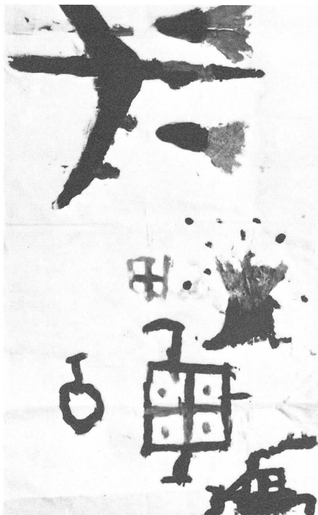
Angst oder die Lust am Spiel mit der Angst werden oft mit Motiven ausgedrückt, welche die Kinder von ihrem Medienkonsum her kennen.

Ich kann spontan drei Gruppen von Reaktionen auf den