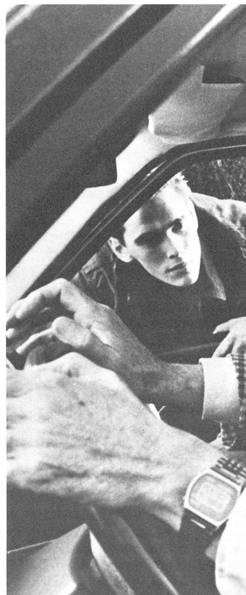
Schlapper Agententhriller: «Target» von Arthur Penn als einer von 15 Beiträgen im «Kinokalender» (SWF 3).