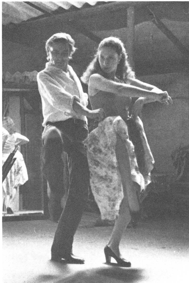
Laura del Sol und Antonio Gades in «El amor brujo».