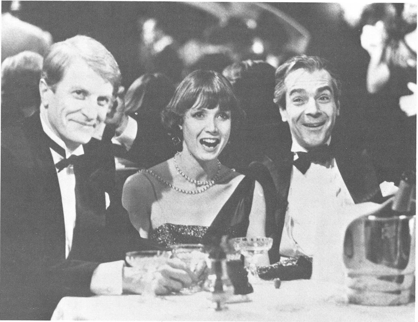
Spiel mit dem Feuer: «Mélo» von Alain Resnais (mit André Dussollier, Sabine Azéma und Pierre Arditi).