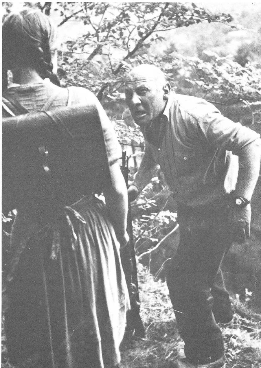
Gritli (Maria) Schell in ihrer ersten Filmrolle und Heinrich Gretler als Aussenseiter Arnold Murer.

Keine Spur von dörflicher Harmonie in «Steibruch»: Hier dominieren Vorurteile, Egoismus und Fremdenfeindlichkeit.