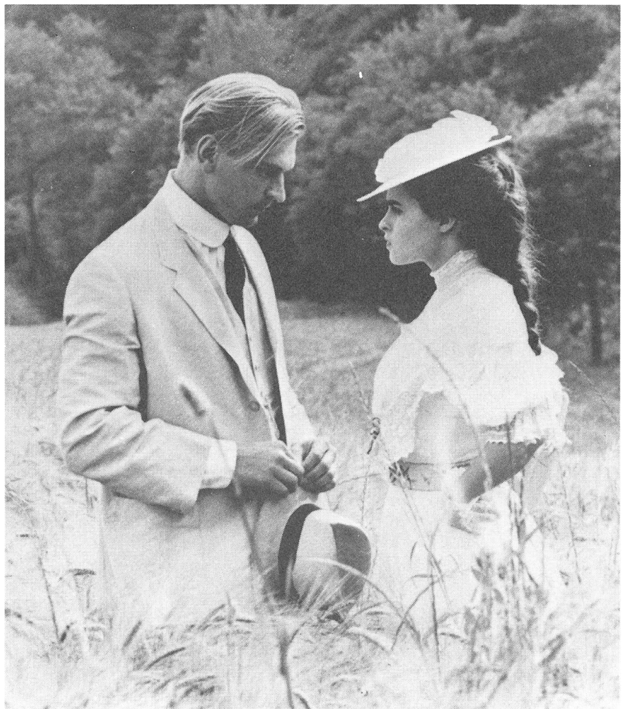
Julian Sands und Helena Bonham Carter in «A Room With a View».

Der unkomplizierte Emerson, ein liberaler und aufgeklärter Geist, vertraut Lucy schon bald seine Sorgen an: Der introvertierte und etwas schwärmerische George grüble einfach zuviel dem Sinn des Lebens nach. Als Lucy der lästigen Aufsicht ihrer Tante für einmal entfliehen kann, wird sie Zeugin einer