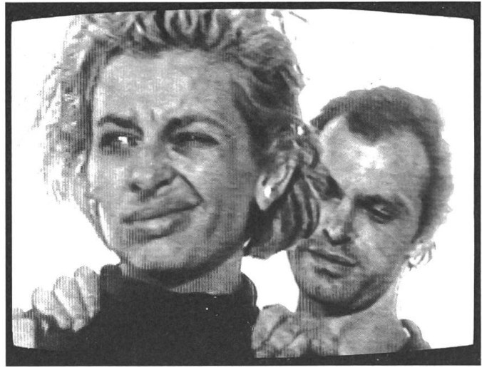
Vom Computer bearbeitete Bilder: «Viewers of Optics» von Alexander Hahn. – Bild rechts: «Destination Zero» von Torsten Seibt – ein ästhetisches Experiment.

«Optics», beschreibt den Unterschied folgendermassen: Video beschiesst den Zuschauer gleichsam aus der Bildröhre, während der Film durch den Projektorstrahl (sanft) von hinten über seinen Kopf hinwegflutet. Dem Video ist in gewisser Weise ein aggressiver, ein synthetisch-kalter Charakter eigen, den es selbst bei einer Grossprojektion nicht gänzlich einbüsst.