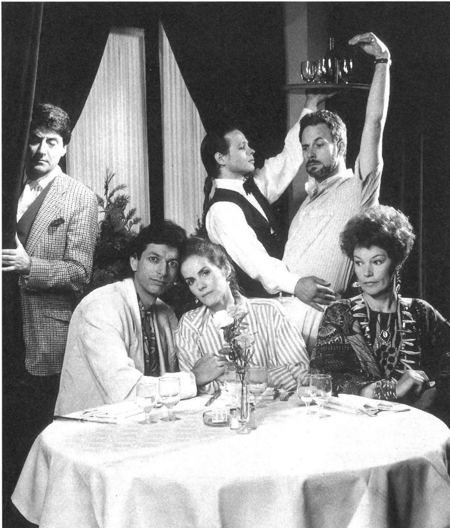
Süffige Posse über die Psychiatrieabhängigkeit der Amerikaner: Tom Conti, Jeff Goldblum, Julie Hagerty, Cris Campion, Christopher Guest und Glenda Jackson in «Beyond Therapy» von Robert Altman.

Eine Erkenntnis gewinnen dann vorläufig nur Prudence und Bruce (bei den beiden Therapeuten hat dieses Erkennen vielleicht schon längstens eingesetzt, sich jedoch inzwischen derart verkehrt, dass sie gar nichts mehr beim Wort nehmen können). Sie wollen lernen, ihre Widersprüche zu akzeptieren, und wollen sich zwischen Norm und Irrsinn ausleben, «jenseits jeglicher Therapie». Es ist daher nur legitim, wenn ihnen ein altmodisches Happy-End vergönnt ist. Wenn sie ihrer gemeinsamen Hochzeit entgegenlaufen, dann ist das so schön und wahrhaftig wie im Leben oder eben nur noch wie im Film. Schliesslich – wundert sich Prudence einmal – gelingt es auch Betsy Drake in «Every Girl Should Be Married» (1949) einfach so, sich Cary Grant zu angeln. ■