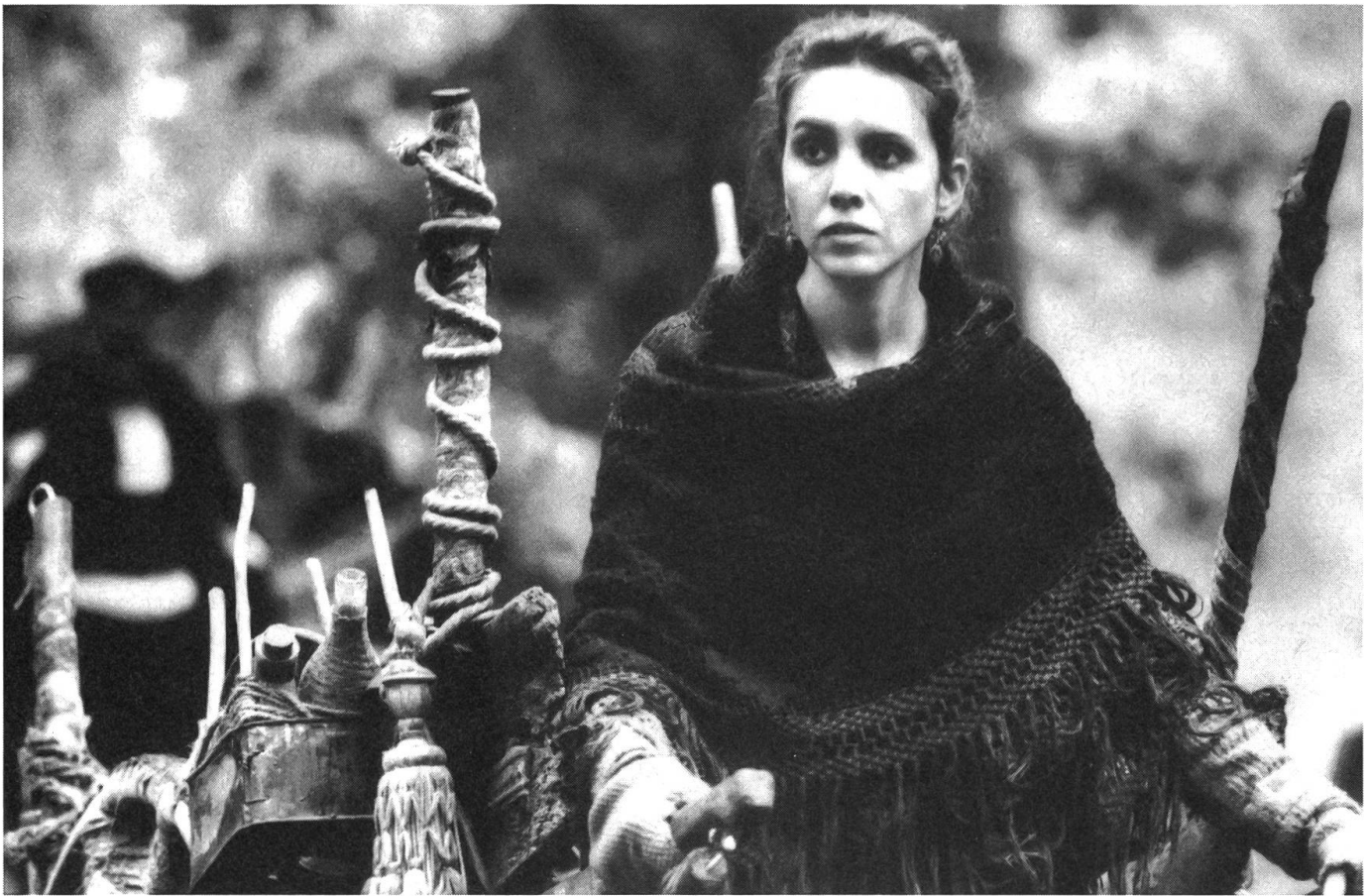
Ana Belén in «Divinas palabras» von Jose Luis Garcia Sánchez.

erschienen. Das zunächst für unaufführbar gehaltene Bühnenstück wurde erst 1933 in Madrid uraufgeführt, eroberte dann die Bühnen in Spanien und Frankreich. 1971 wurde das Stück von Hans Neuenfels in Stuttgart, 1974 von Johannes Schaaf in München inszeniert. Valle-Inclán hat mit diesem Stück – lange vor Brecht – «episches Theater» geschaffen. Die Wirklichkeit radikal deformierend, gestaltete er die Figuren und Szenen tragisch, grotesk und makaber und leitete damit über zu den «esperpantos», den eigentlichen Grotesken der zwanziger Jahre.