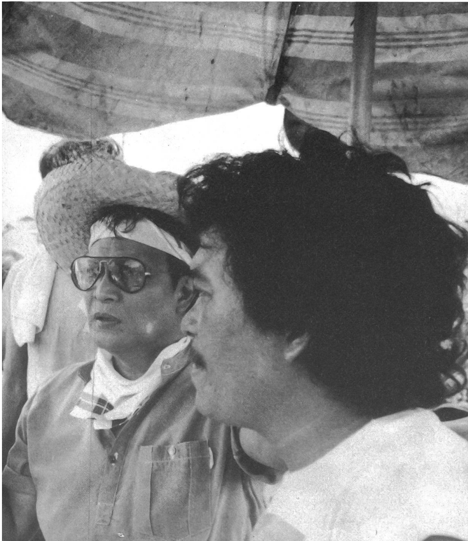
Visuell eindringliche literarische Adaption aus Korea: «Nagunenon gilesodo schizi annunda» (Der Mann mit den drei Särgen) von Chang-Ho Lee (Bild links). – Filmen unter repressiven Bedingungen: «Signed: Lino Brocka» von Christian Blackwood (USA, Bild Mitte) und «Imagen latente» (Das latente Bild) von Pablo Perelman (Chile).