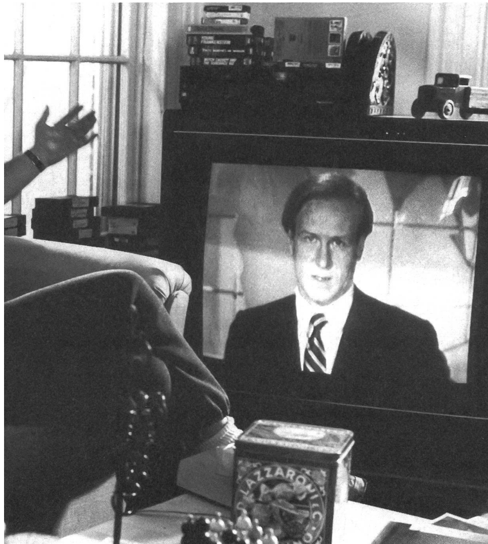
Bericht aus einer unheilen Medienwelt: «Broadcast News» von James L. Brooks.

Jahre später treffen sich Tom, Aaron und Jane wieder: Tom ist auf den höchsten Chefposten der Nachrichtenabteilung berufen worden. Seine Ansprache im neuen Amt strotzt vor angenehmer Überraschung und erhabener Bescheidenheit. Seine zukünftige Gattin, ihn bewun-