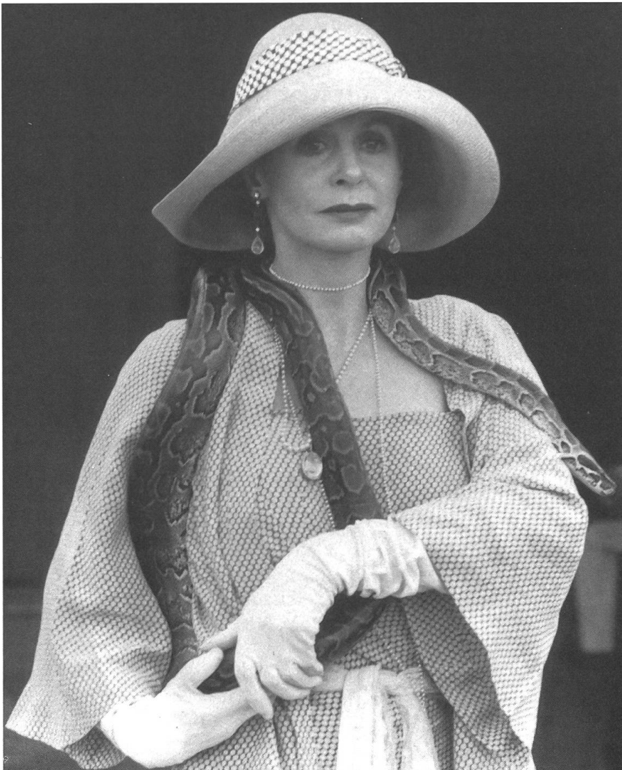
Sarkastischer Schwanengesang auf den englischen Adel als Vertreter des Kolonialismus: «White Mischief» von Michael Radford.

Radford benutzt diesen Kriminalfall einerseits, um das Spannungsfeld zwischen den Menschen offenzulegen, die im stillen Einverständnis miteinander auszukommen vorgeben. Zum anderen exemplifiziert der Film anhand des Falls, wie sich diese Menschen mit ihrer grenzenlo-