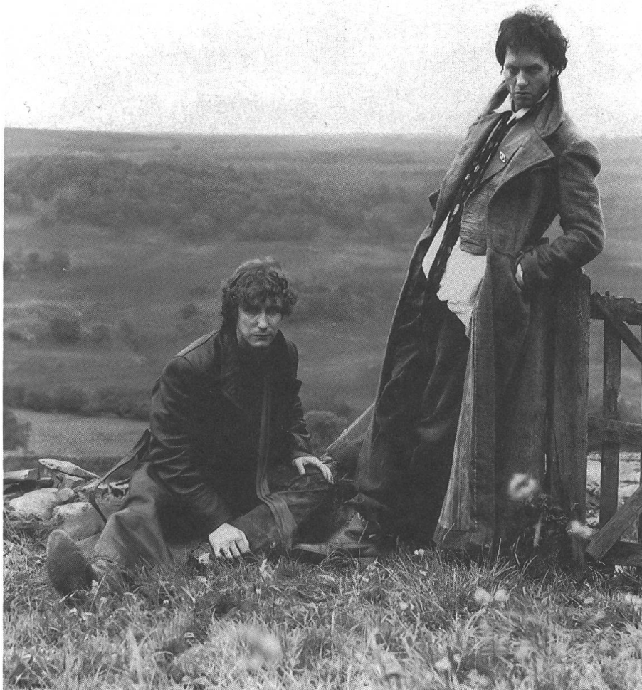
Paul McGann als I, Richard E. Grant als Withnail.

Dramaschule und als Schauspieler gemacht hat; der Film ruft denn auch unverkennbar die Stimmung der sechziger Jahre in Erinnerung. Dennoch zeugt auf der Musikspur die teilweise Neuinterpretation von Pop-Klassikern jener Tage bereits vom retrospektiven Blick, den der Film vom heutigen Standpunkt aus auf das Damals wirft. Derart drängen sich, gewissermassen zwischen den Zeilen, auch aktuelle Bezüge zum klassenbeherrschten England auf – einem Land, «wo etwas nur gratis ist für denjenigen, der es sich leisten kann» (Withnail), wo prosperierende Bautätigkeit (die Kamera fängt einen Häuserabbruch ein) über