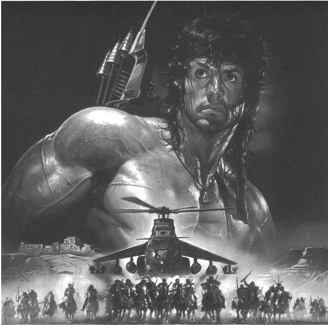
«Wertvoll» – für wen? Die perfekte menschliche Kampfmaschine: Sylvester Stallone («Rambo III»): Restaurierung der mythischen, symbolischen und fetischistischen Qualität des Krieges.

auch eine Umwertung der Technologie zur Folge. In den Kriegsmelodramen war eher das Traumatisierende, das Tragische herausgestellt worden, das Opfer, das die Männer für eine vielleicht trotz allem lohnende Sache gebracht hatten. In den neuen «harten» Kriegsfilmern dagegen nahmen die Kampfmaschinen eine Stellung von durch und durch emotionaler Besetzung ein. Die Filme selber wurden technologischer; ihr Stolz bestand darin, soviel Kriegsmaschinerie darzustellen wie nur möglich, während sich der klassische Kriegsfilm mit dem Montieren von Dokumentarmaterial begnügt hatte. Immer wieder wurde neben die persönliche Erfahrung die Perspektive des Feldherrenhügels