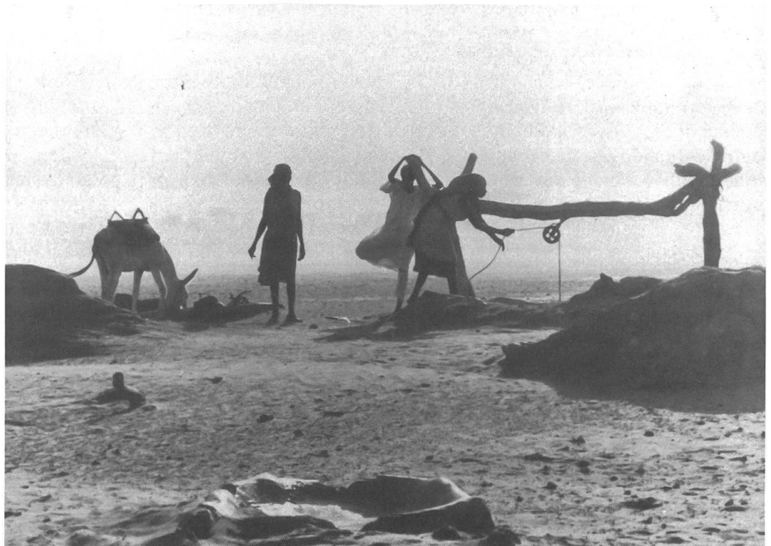
Dürrekatastrophe im Sudan: Folge eines langen Prozesses und einer anhaltenden Systemkrise.

verkettet: Sie erteilt der sudanesischen Landwirtschaft nur dann Kredite, wenn sie bestimmen kann, was angebaut wird. Und seit den Zeiten der Kolonisation glaubt man, dass sich die Agrarflächen des Sudan am rentabel-