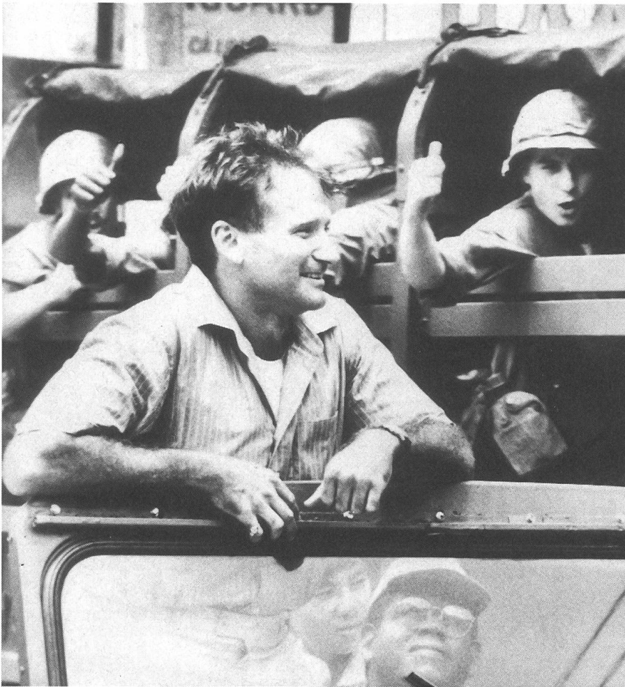
Cronauer kommt mit seinen Sprüchen bei der Truppe an: «Good Morning Vietnam» von Barry Levinson.

ständig schussbereite US-Soldaten auf Patrouille, hinter Geschützen und auf Zerstörern gezeigt, die hohes Selbstvertrauen und uneingeschränkten Glauben an die Macht der USA zu haben scheinen. Über allem weht die amerikanische Flagge, und Cronauer legt dazu den Song von Louis Armstrong «What a Wonderful World» auf den Plattenteller.