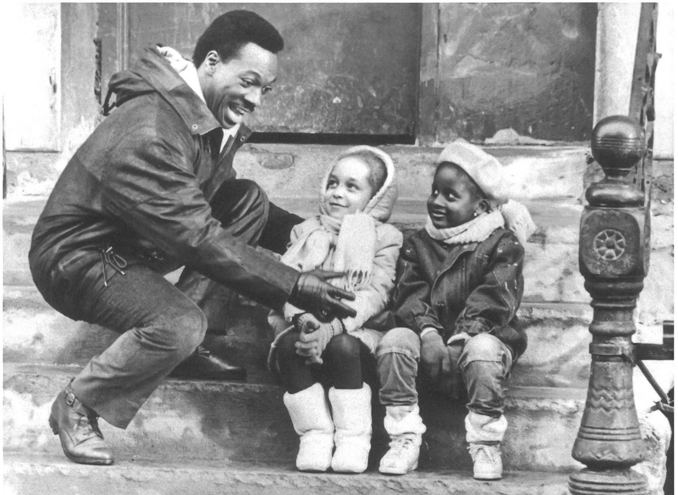
Der Prinz aus Zamunda: Eddie Murphy als Kinderfreund.

scheffelte mit seinem frechen Mundwerk Millionen in «Beverly Hills Cop» I und II. John Landis machte in der Zwischenzeit Filme wie «Into the Night», «Spies Like Us» oder «Three Amigos». Ein Glücksfall hat Landis und Murphy nun wieder zusammengeführt, und es entstand für beide ihr bester Film seit «Trading Places». John Landis war sich zuerst gar nicht sicher, ob er überhaupt noch mit Eddie Murphy zusammenarbeiten konnte, nachdem dieser zum Megastar avanciert war. «Du wirst allmählich zum Monster», meinte Landis bei den Vertragsverhandlungen zu Murphy. Worauf dieser witzelte: «Da bist du schon selber schuld,