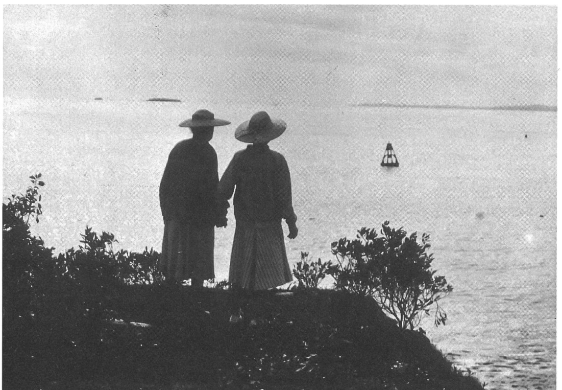
Scheinphilosophische Nett- und Nichtigkeiten: «The Whales of August» von Lindsay Anderson.

Ganz und gar nichts Vergleichbares lässt sich von der zwölf Jahre jüngeren Bette Davis sagen, die jemand ganz an-