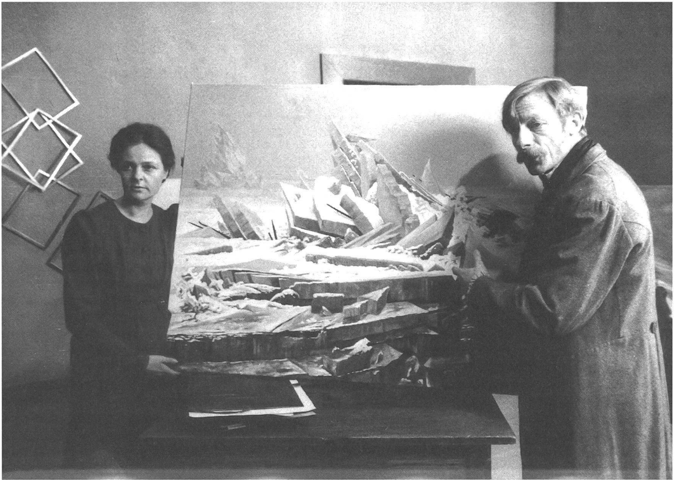
Bekannter Maler der deutschen Romantik: aus «Caspar David Friedrich – Grenzen der Zeit» von Peter Schamoni.