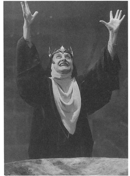
Zwergenheld Willow (Warwick Davis) und seine böse Gegnerin, Königin Bavmorda (Jean Marsh).

im Land der normalwüchigen Daikinis ist hart. Hätte Willow nicht noch zwei Wichtel, die ihn treu begleiten, und einen Daikini-Krieger, dessen Freundschaft er gewinnen kann – Willow und das Mädchen wären längst vom Totenkopfgeneral Kael und seinen schwarzen Kriegern getötet worden. Doch mit vereinten Kräften, List und der Hilfe einer guten Fee gelingt Willow das schier unmögliche: Königin Bavmorda wird besiegt und Elora Donan gerettet.