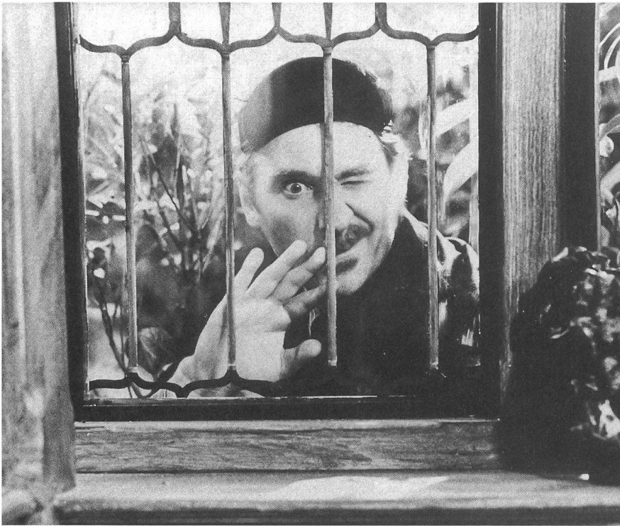
Verspeist Aquariumsfische: Kevin Kline als Otto.

Sinn, sondern bewundert die Viecher abgöttisch. Sein Milieu-Kumpel Otto (Kevin Kline, «Cry Freedom», «Sophie's Choice») will von ihm das Geheimnis erpressen, wo die gestohlenen Diamanten versteckt sind, und verzehrt in einem Akt bestialischer Grausamkeit vor seinen Augen die geliebten Aquariumsfische – roh, frisch aus dem mit Sauerstoff angereicherten Londoner Hahnenwasser. Aus Schweizer Sicht ein klassischer Fall für die Basler Staatsanwaltschaft.