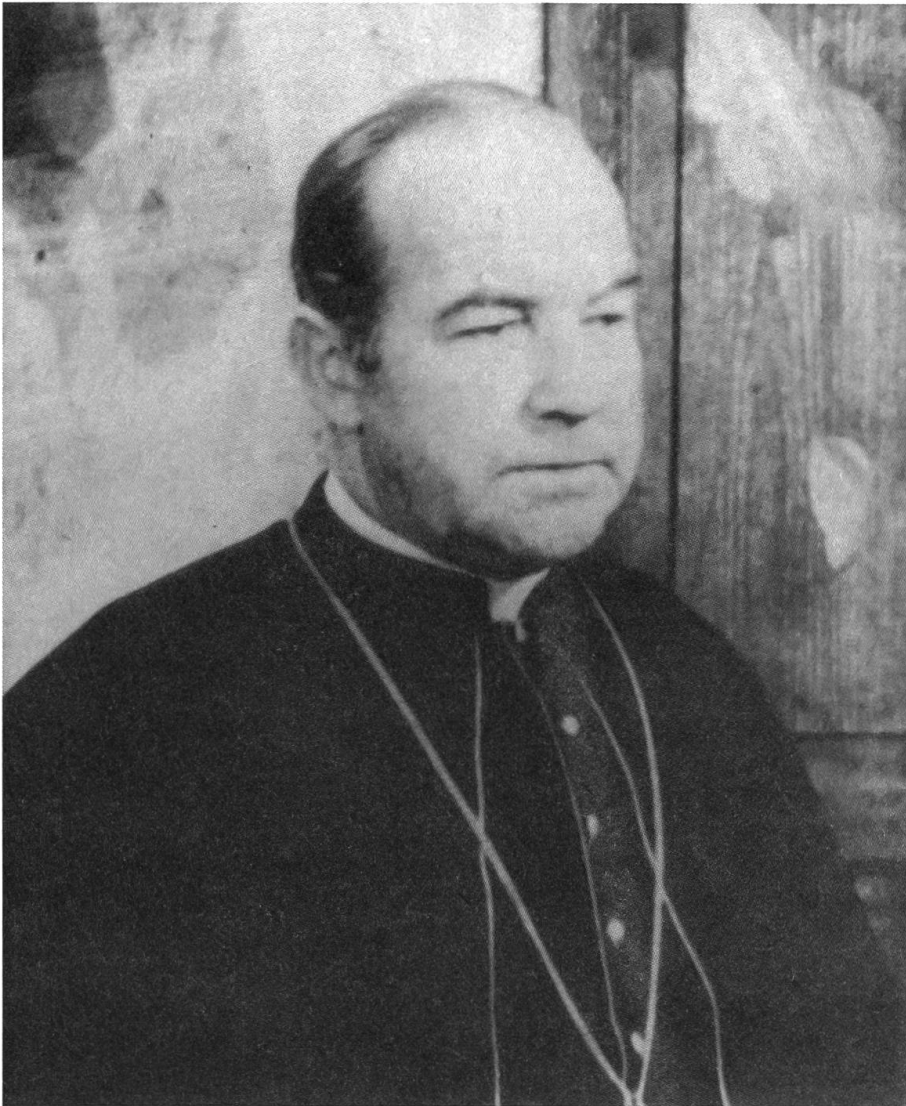
Die Skizze als Drehvorlage: Wie sich Federico Fellini in «Il bidone» Broderick Crawford als Bischof vorstellte und wie er im Film aussah.